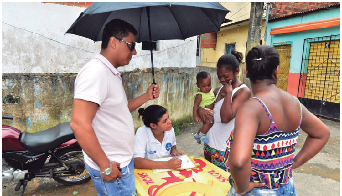
As famílias que perderam suas moradias estão sendo cadastradas pela Prefeitura no Minha Casa, Minha Vida