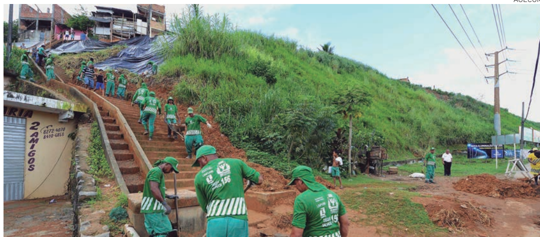
A Prefeitura está fazendo avaliação dos impactos das chuvas para desenvolver projetos visando soluções definitivas

Em relação às doações, até a manhã desta terça-feira a Prefeitura já recebeu 1.300 colchões, 1.200 cestas básicas, 834 cobertores, 770 kits de higiene e limpeza, 1.140 toalhas, 30 kits de bebês, compostos por itens como farinha para mingau, leite e fraldas, além de água (dois mil garrafas de 5 litros), travesseiros e outros suprimentos solicitados ao Ministério da Integração pela Defesa Civil de Salvador (Codesal).