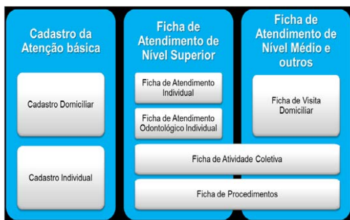
Figura 1 - Aplicação das sete fichas utilizadas no SIS AB.