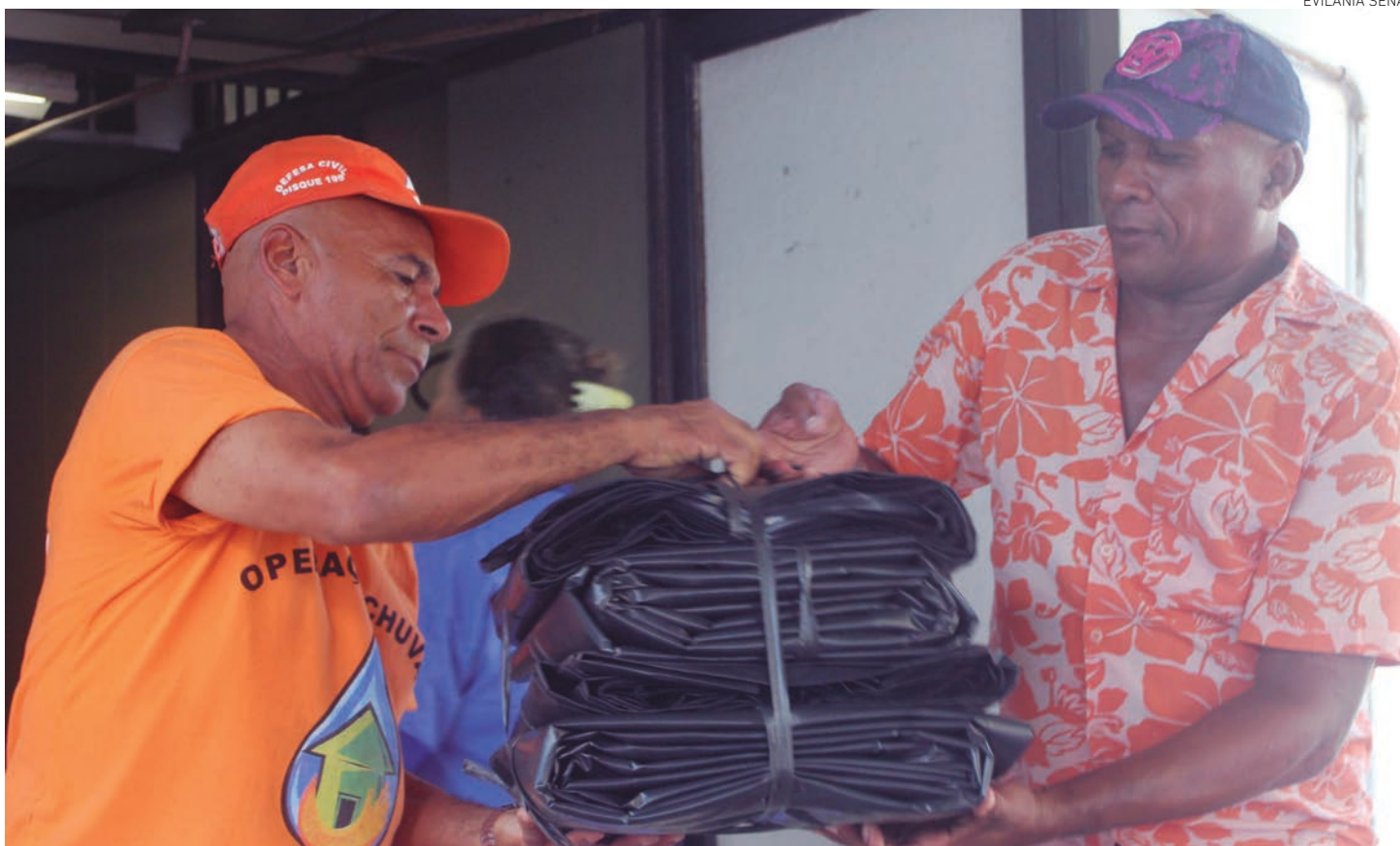
Morador recebe lona para proteger o terreno onde mora. Estão cadastradas 650 famílias para receber o equipamento que evita maior prejuízo para o local