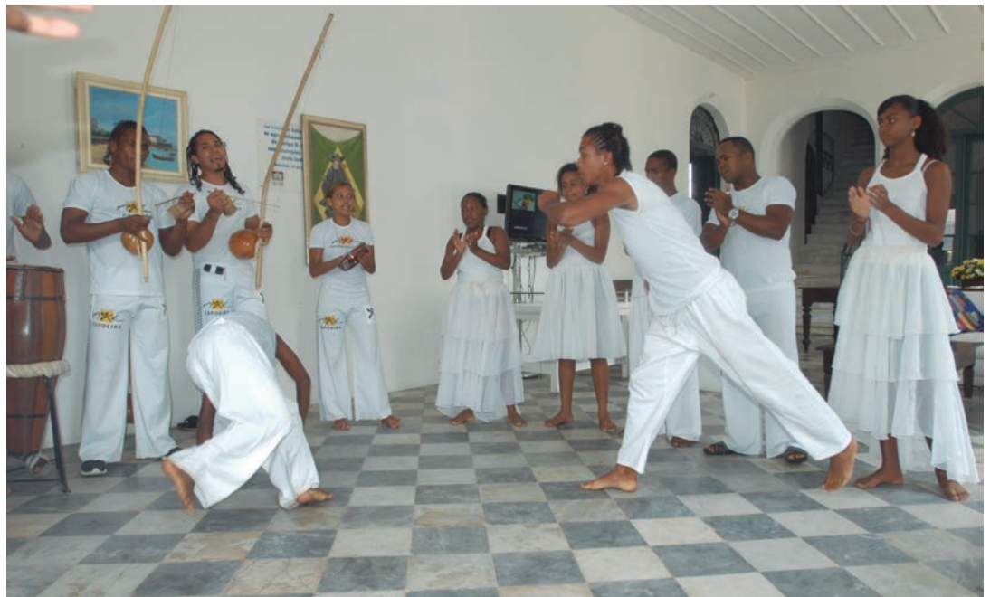
Uma das linhas de ação do concurso é focada na troca de conhecimento, no reconhecimento e na difusão da capoeira

Já a linha Preservação e Memória da capoeira beneficia diferentes modalidades, que podem ser digitais, audiovisuais, exposições, instalações, publicações, sítios da web, portais e produtos correlatos.