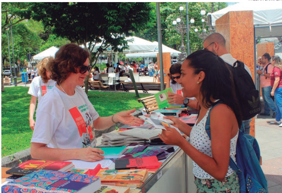
O PMLLB promoveu, no Campo Grande, a Parada do Livro 2014, que reuniu 6 mil pessoas em outubro passado

O Plano Municipal do Livro, da Leitura e da Biblioteca de Salvador foi instituído pelo Decreto 24.590/2013 e decorre da política nacional de cultura direcionada ao livro e a leitura, expressa pelo Plano Nacional do Livro e da Leitura (PNLL). O núcleo diretivo é composto por representantes da Vice-Prefeitura, Secretaria Municipal da Reparação (Semur), Secretaria Municipal da Educação (Smed) e da Fundação Gregório de Mattos (FGM).