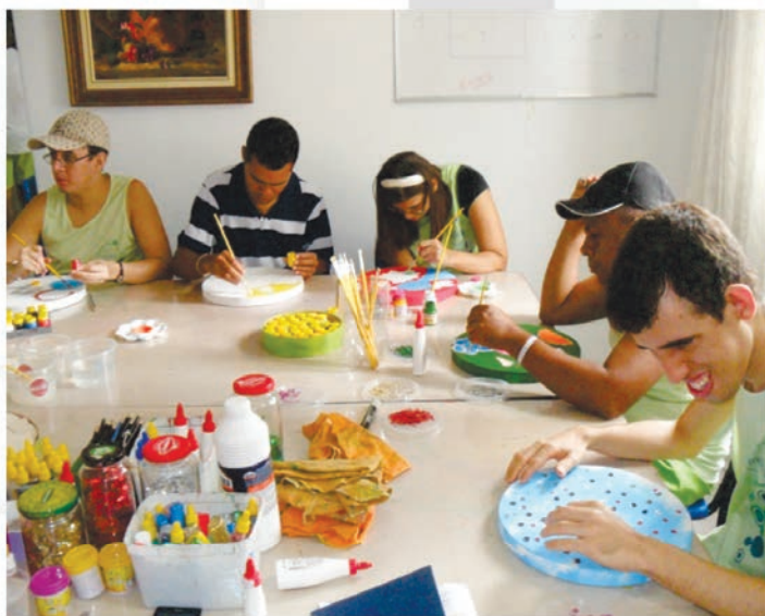
Associação Baiana de Pessoas com Deficiência – Projeto INCLUIR. Projeto: Livre para Voar.