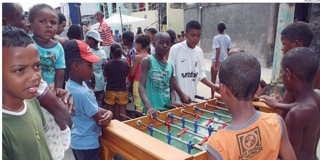
Projeto é realizado das 8 às 12 horas e promove atividades recreativas, esportivas, de entretenimento e lazer

é realizado todo domingo, no Dique do Tororó, também manterá a programação neste fim de semana.