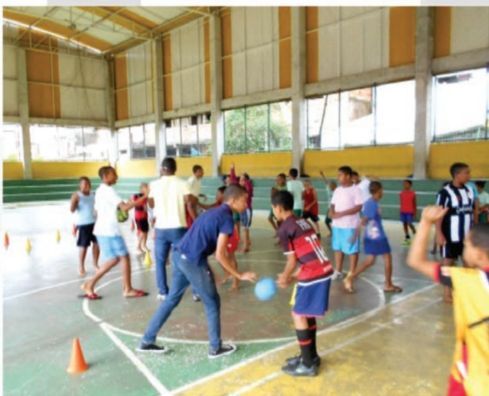
Associação das Comunidades Paróquias de Mata Escura e do Calabetão. Projeto: Educação através da Arte e do Lazer.

Você sabia que no ato da sua Declaração é possível doar até 3% do seu Imposto de Renda Devido para o Fundo Municipal dos Direitos da Criança e do Adolescente - FMDCA?