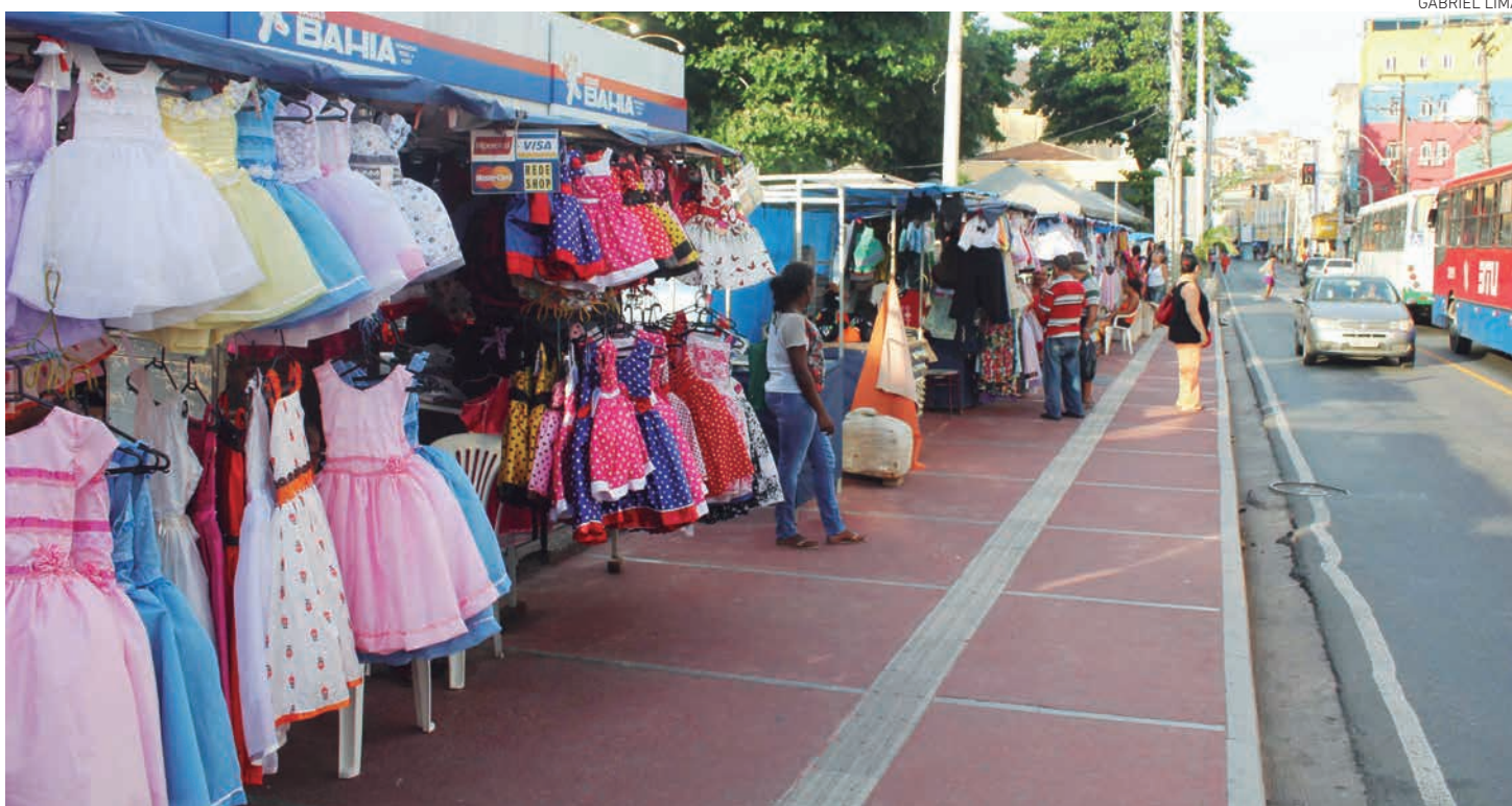
As obras do camelódromo, que ocupa uma área total de 250 m 2 e abriga cerca de 40 vendedores ambulantes, serão finalizadas em 40 dias