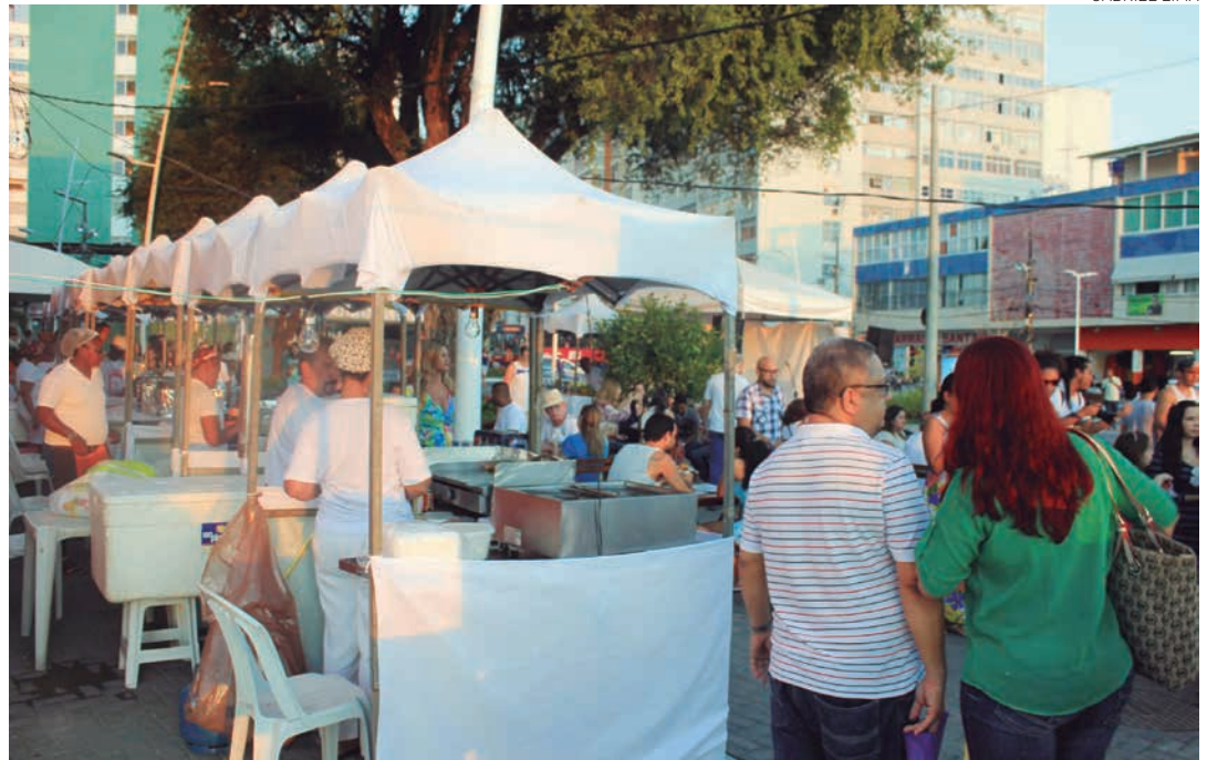
Rota Gastronômica Santos Sabores conta com 20 restaurantes convidados para elaborar um menu especial

Ainda na Barra, sempre às 9h, acontece o ciclo de aulas de Danças Sagradas. A atividade, aberta ao público, é gratuita. Na ordem, entre hoje e o domingo, acontecem aulas de capoeira, dança circular, dança afro, tai chi chuan e dança do ventre. Já os interessados no artesanato local têm