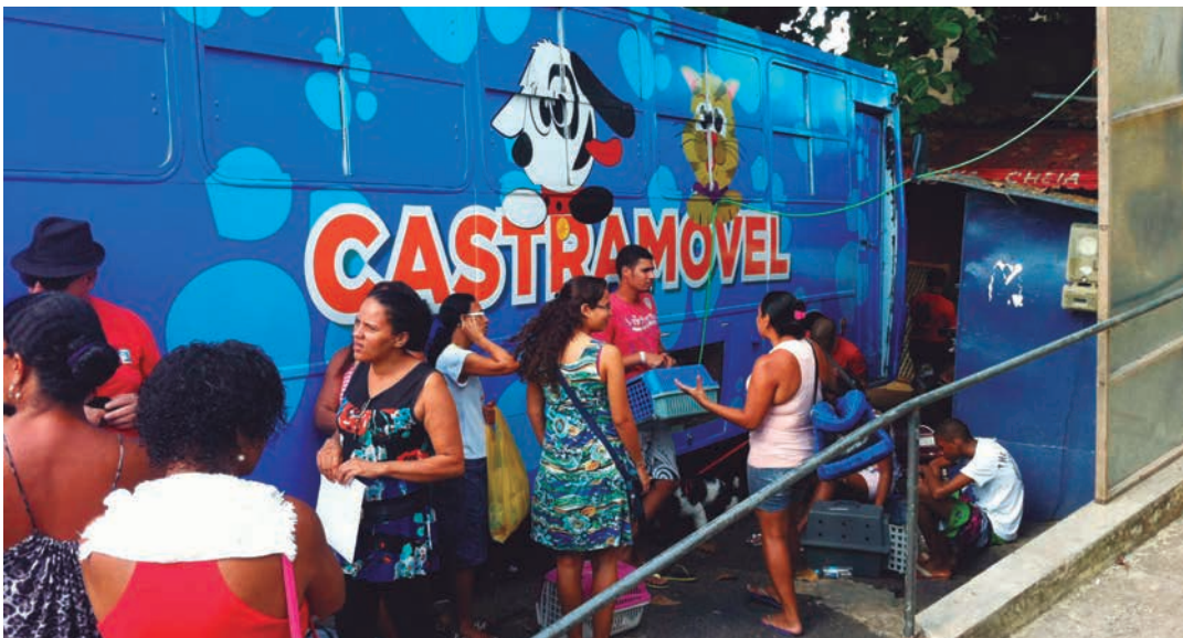
A triagem prossegue às segundas e terças-feiras, das 8h às 12h. É preciso levar cão e gato para avaliação prévia