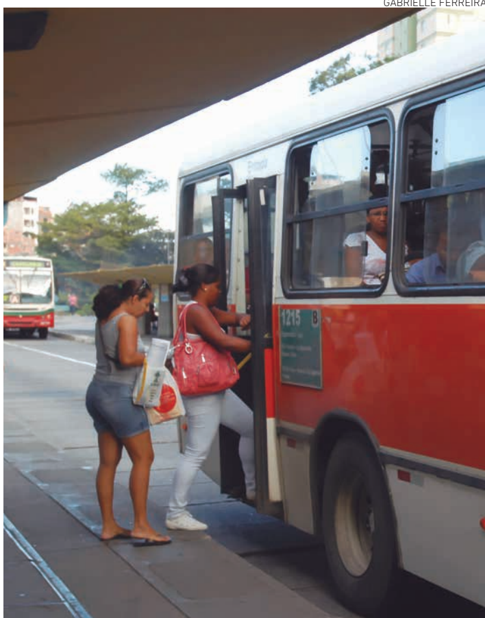
Medida atende a demanda dos passageiros que utilizam os terminais

Aumento da frota visa ampliar acesso de mais de 100 mil pessoas por mês ao local