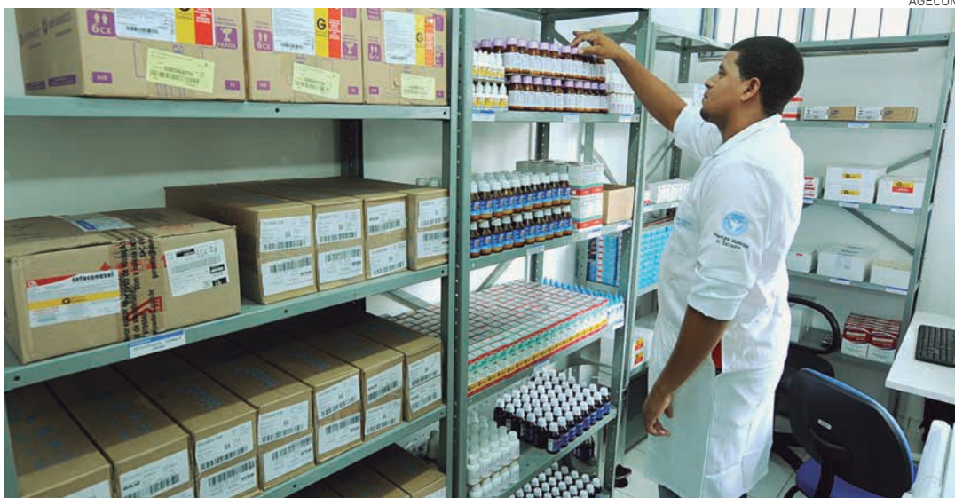
Na unidade são realizados dispensação de medicamentos, curativos, aferição de pressão arterial, entre outros

O prefeito também informou que a Escola Municipal do Engenho Velho da Federação será reconstruída em breve, já que ainda funciona em estruturas pré-moldadas, que não proporcionam a qualidade necessária para a realização das atividades. Está em processo a identificação do imóvel que receberá os alunos, de modo provisório, enquanto as obras forem executadas.