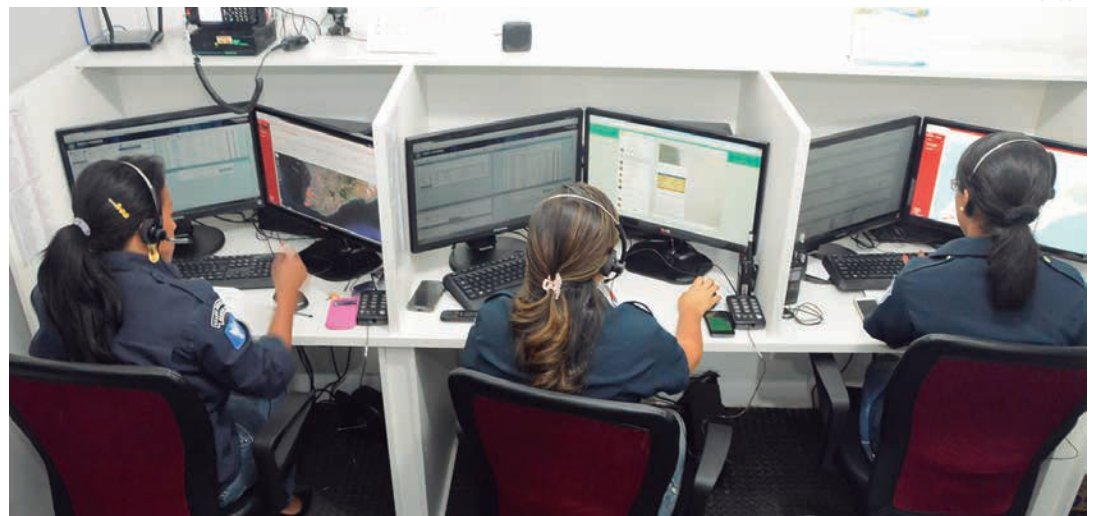
A central promove mais eficiência e dinamismo ao trabalho desenvolvido pelos guardas municipais