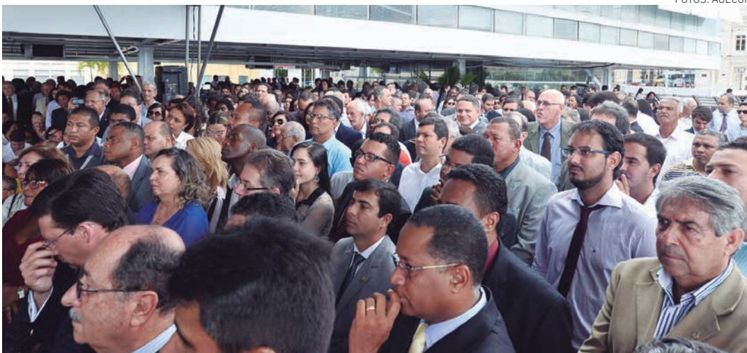
A posse dos novos dirigentes é mais um passo da Prefeitura destinado a promover a melhoria dos serviços