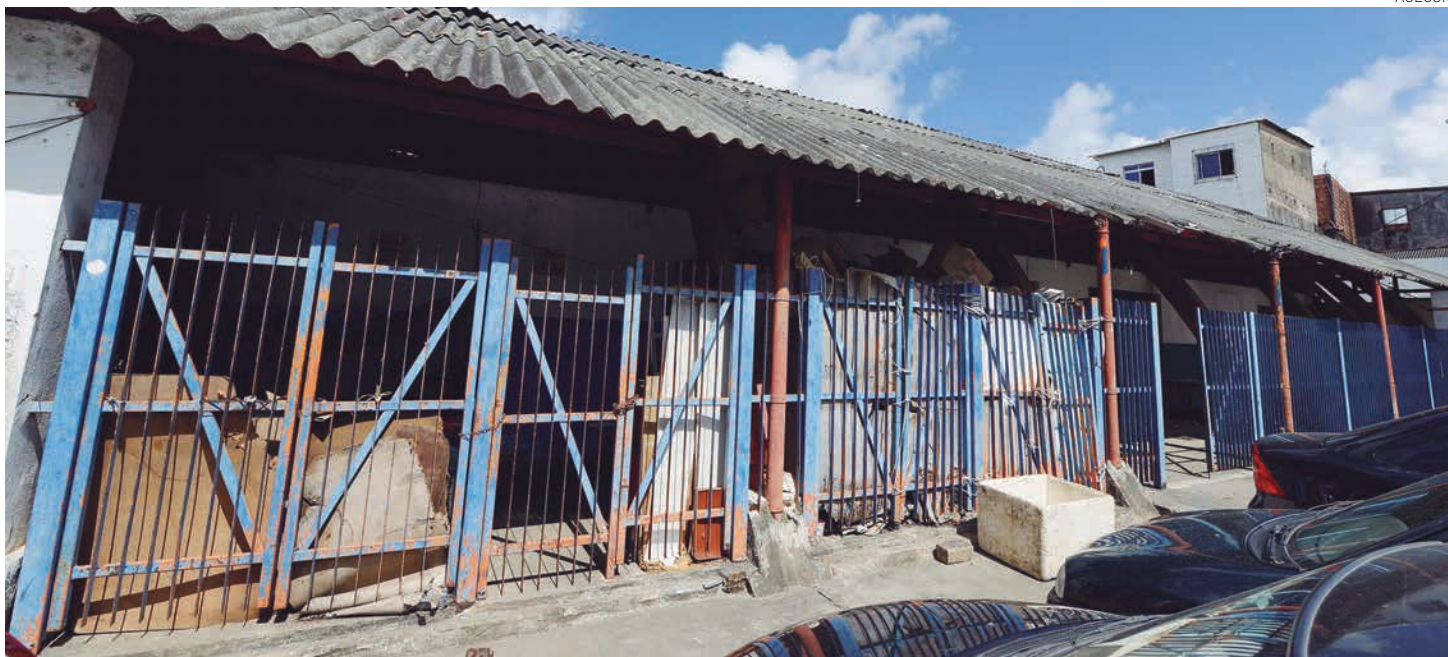
Prédio da Cesta do Povo dará lugar ao equipamento, numa iniciativa que integra o programa de recuperação e construção de mercados municipais