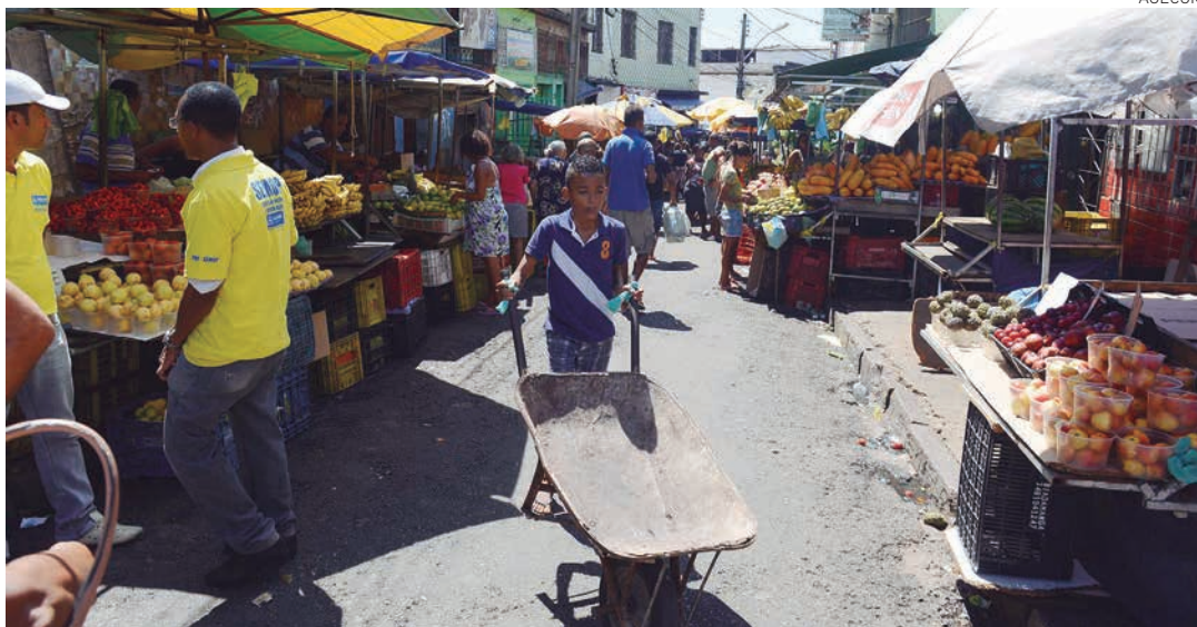
As questões referentes ao ordenamento e licenciamento dos permissionários são de responsabilidade da Semop

Novo equipamento terá 20 boxes e vai funcionar na antiga unidade da Cesta do Povo