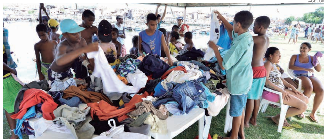
Além dos donativos, a Prefeitura destacou uma equipe técnica para orientar e cadastrar as famílias desabrigadas

Redonda”, poucos moradores ainda conseguiram recuperar alguns pertences, mas a grande maioria perdeu tudo o que possuía. “As pessoas perderam móveis, roupas, eletrodomésticos. Tudo mesmo. De manhã, algumas famílias ainda apareceram por aqui, na tentativa de encontrar alguma coisa intacta, mas o fogo levou tudo o que eles tinham”, lamentou. O líder comunitário ressaltou ainda a importância e a celeridade da Prefeitura, tanto no socorro às vítimas, como nos serviços humanitários prestados de imediato. “O trabalho da Prefeitura por aqui está sendo de primeira. Desde a quarta-feira já sentimos a presença deles na comunidade. Ninguém ficou desamparado. Quem procurou o Centro Social teve acesso a comida, água, roupas e um lugar para dormir”, pontuou.