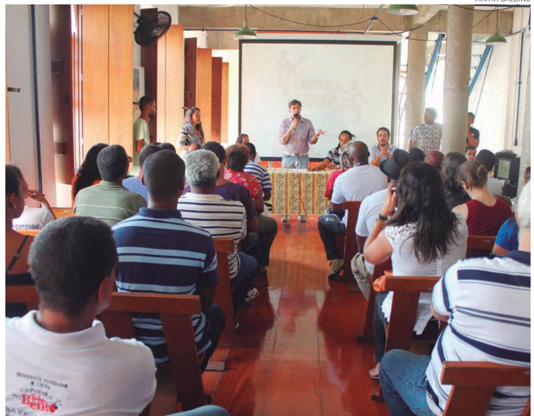
Evento, promovido pela Fundação Gregório de Mattos, foi realizado na última quarta-feira, na Casa do Benin