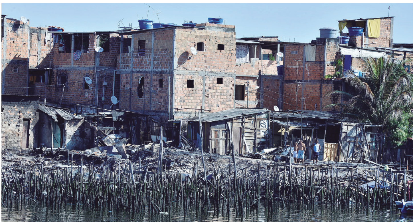
Famílias que perderam tudo no incêndio receberão da Prefeitura aluguel social, cesta básica, cobertor, colchonete e material de higiene