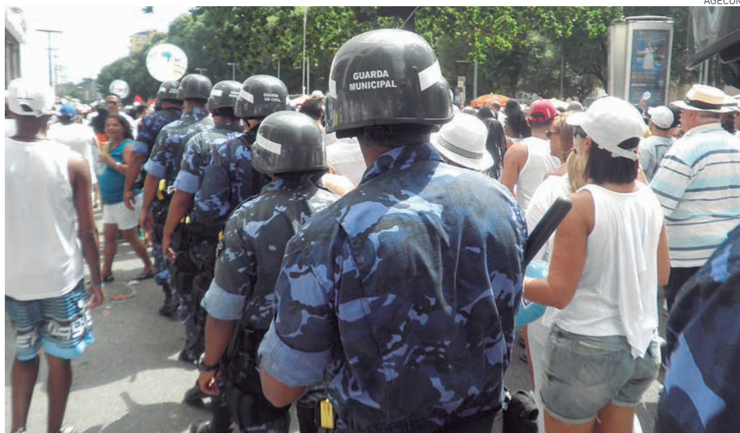
Agentes apoiam ações de reforço à segurança, fiscalização do comércio informal e limpeza urbana

montados, além de utilizarmos nossas Bases Móveis ao longo do circuito da lavagem, com intuito de ser mais um ponto de auxílio à população”, pontuou.