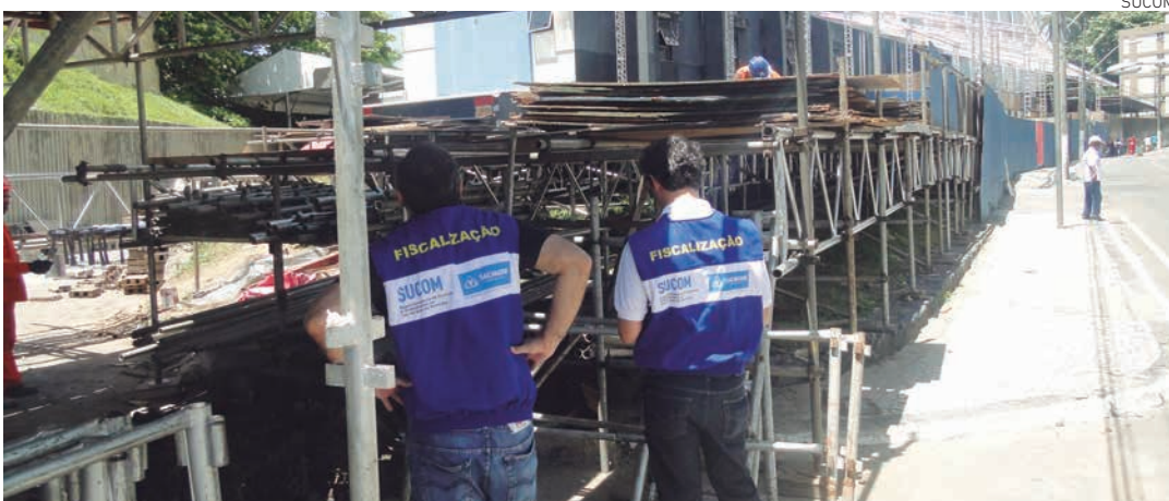
Propósito das vistorias é verificar se equipamentos como camarotes estão de acordo com as regras de instalação

Empresas interessadas em montar camarotes para o Carnaval de 2015 ainda podem solicitar o alvará na Central de Licenciamento de Eventos (CLE), composta por representantes da Sucom, Transalvador, Sefaz e Limpurb, entre outros órgãos. A Central fica localizada na Avenida ACM, no edifício Thomé de Souza, 18º andar, sede da Sucom, de segunda a sexta-feira, entre 9 e 17h. O prazo para protocolar o projeto é de 10 dias antes do início da festa. A liberação é concedida em até sete dias.