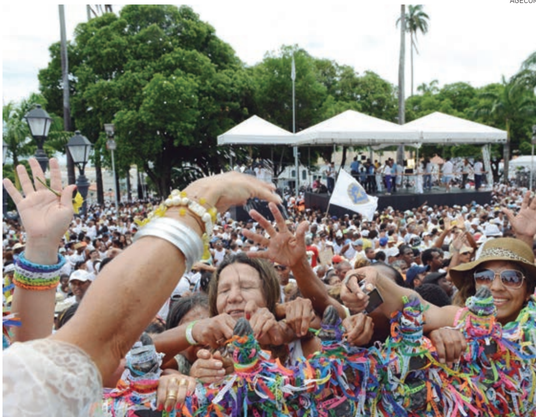
Fiéis andam cerca de oito quilômetros até a Colina Sagrada, para louvar Nosso Senhor do Bonfim

Serviços essenciais garantirão conforto a baianos e turistas que acompanharão o cortejo