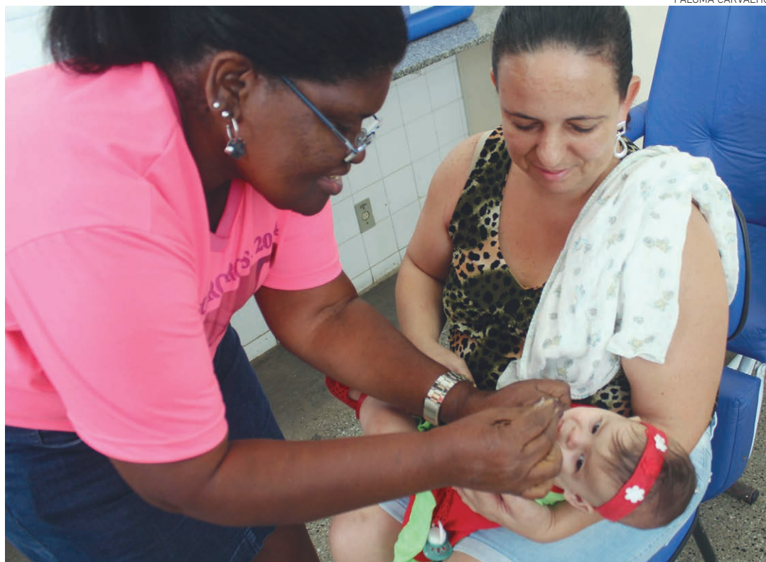
Cerca de 125 mil crianças residentes em Salvador já foram protegidas, o que representa uma cobertura de 81%