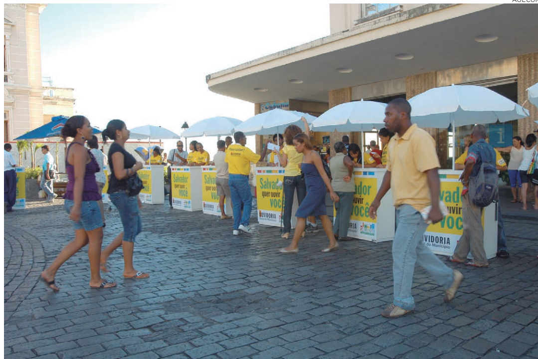
A Ouvidoria fez registros de solicitações no Carnaval de 2014 com o projeto “Salvador quer ouvir você”

A Ouvidoria também esteve presente nos dois grandes eventos realizados na cidade em 2014: o Carnaval, com o projeto “Salvador quer ouvir você”, e a Copa do Mundo de Futebol da Fifa. Em ambas as ocasiões, foram feitos registros de solicitações e avaliação dos serviços públicos municipais prestados pelos órgãos da Prefeitura. Para aperfeiçoamento das atividades, a OGM também esteve presente em encontros nacionais de Ouvidoria para compartilhamento de experiências, assim como a promoção do II Encontro da Rede de Ouvidores Municipais para avaliação e reformulação do papel dos ouvidores como elemento estratégico da gestão.