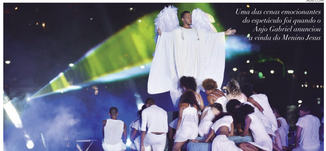
Uma das cenas emocionantes do espetáculo foi quando o Anjo Gabriel anunciou a vinda do Menino Jesus

pretar a canção "Maria, Maria", de Milton Nascimento. Para os quatro dias de apresentação, a Prefeitura investiu cerca de R$ 700 mil.