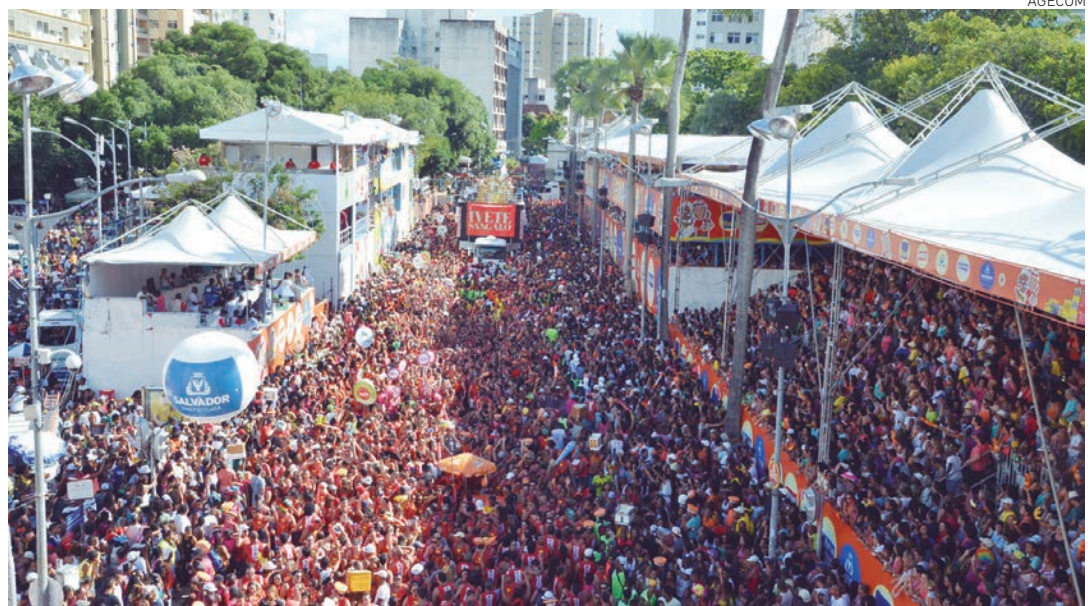
Os ambulantes que trabalharão durante o Carnaval receberão treinamento de 6 a 21 de janeiro, na Semop

A Semop iniciou, sexta-feira, o cadastramento dos ambulantes que irão trabalhar no Carnaval. Conforme a Portaria 194/2014 publicada no Diário Oficial do Município, o cadastramento pode ser feito até o próximo dia 30, através do site www.ambulante.salvador.ba.gov.br . Ao finalizar o processo de cadastramento, o ambulante é informado sobre a data e horário da capacitação para o Carnaval, assim como o dia do licenciamento. O treinamento será de 6 a 21 de janeiro, no auditório da Semop, na Rua 28 de Setembro, Baixa dos Sapateiros, nos dois turnos, e será exigência para o licenciamento dos trabalhadores informais.