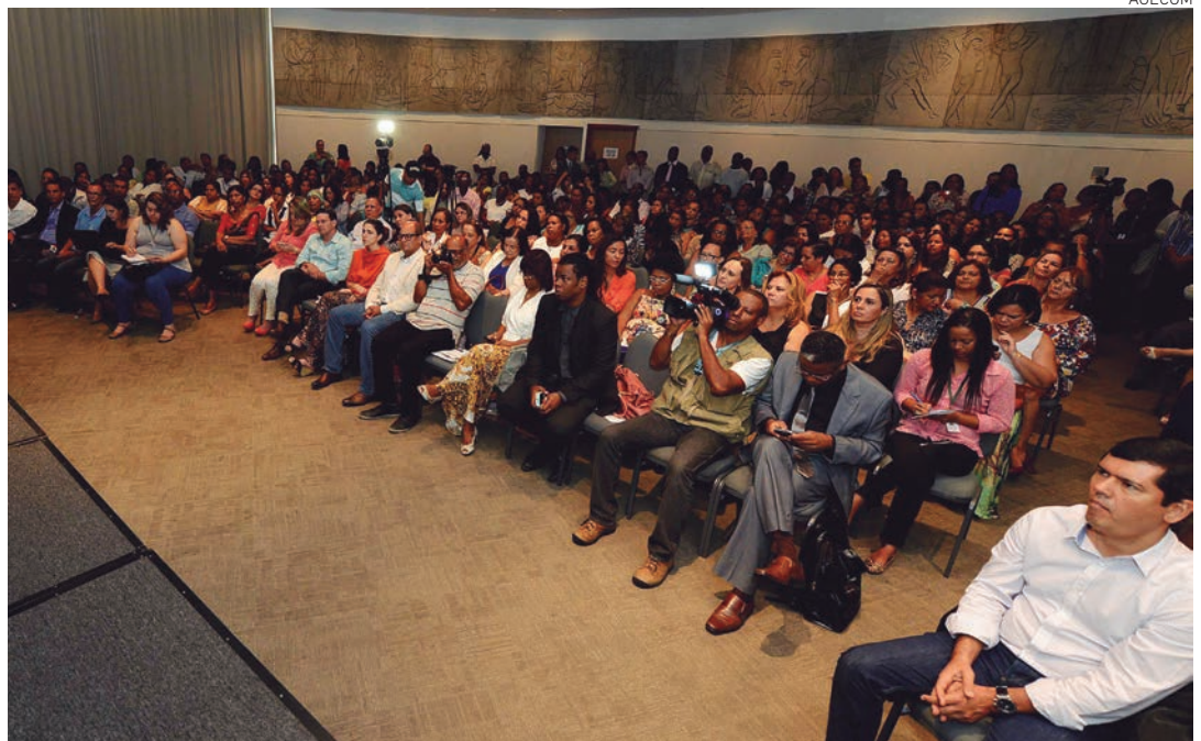
Aguardado há quase duas décadas pela categoria, o plano vai beneficiar cerca de 9 mil servidores