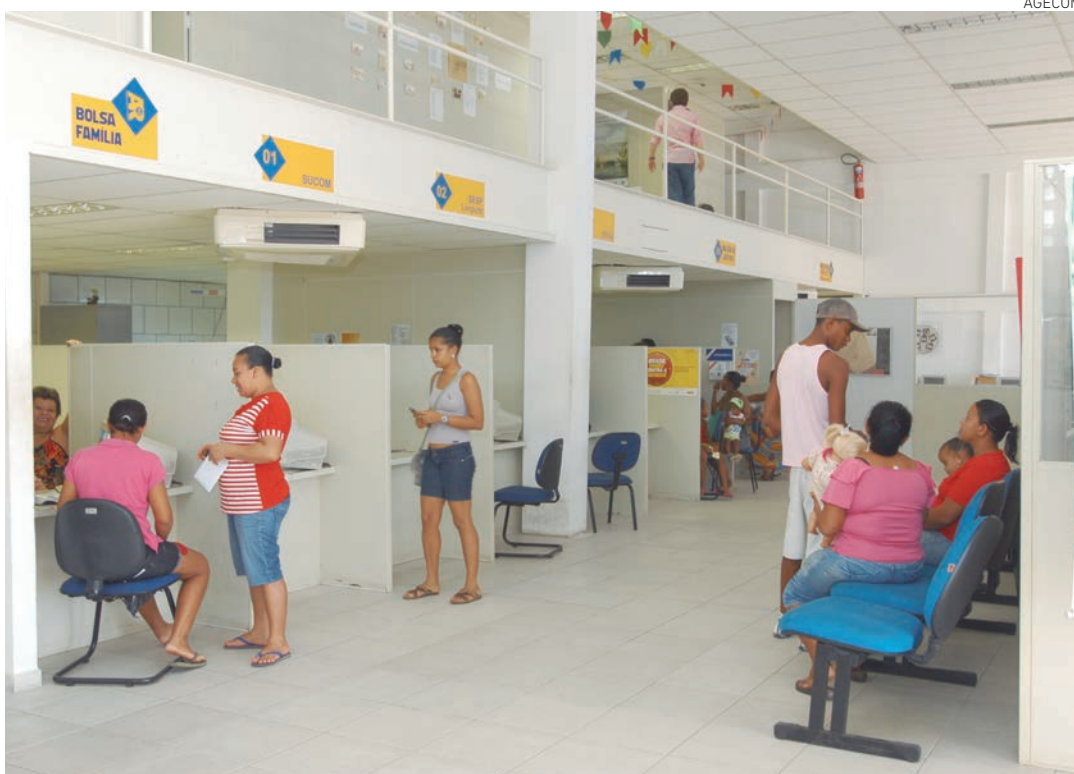
O trabalho realizado nas Prefeituras-Bairro passa por um sistema de registro e acompanhamento das demandas

Todo o trabalho realizado nas Prefeituras-Bairro passa por um sistema de registro e acompanhamento das demandas, recebidas pelos funcionários dos próprios órgãos que atendem nos guichês. Essas demandas são encaminhadas aos setores responsáveis para que sejam tomadas as devidas providências. O processo resulta em uma maior agilidade nas respostas para os cidadãos.