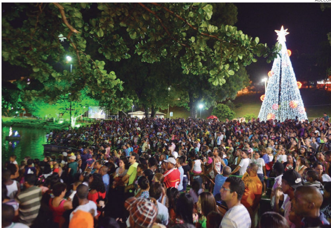
A encenação, que aconteceu também em 2013, este ano será entre os dias 19 e 22 de dezembro, sempre às 20 horas