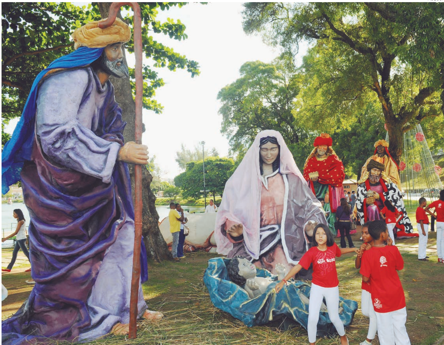
O presépio gigante será inaugurado hoje e ficará no Dique até 6 de janeiro, Dia de Reis. O ano passado, a atração encantou crianças e adultos