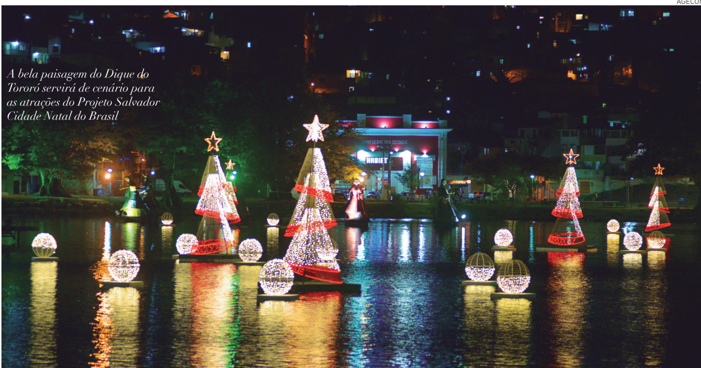
A bela paisagem do Dique do Tororó servirá de cenário para as atrações do Projeto Salvador Cidade Natal do Brasil