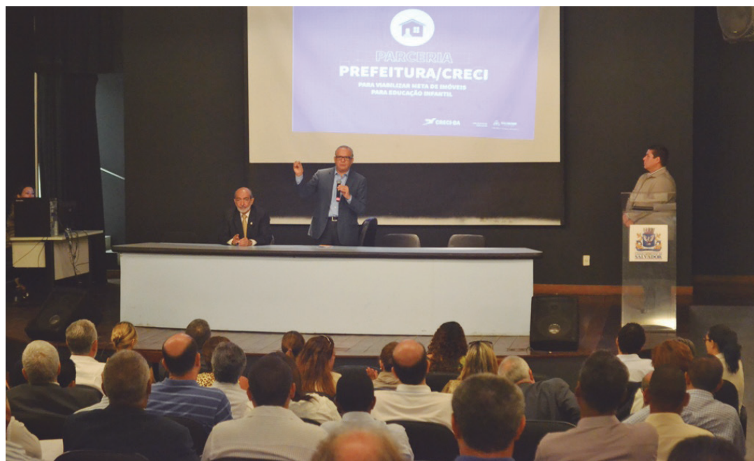
Encontro aconteceu no Centro Cultural da Câmara, com representantes da Prefeitura, Creci-Ba e corretores

sível, ter área mínima de 1200 metros quadrados, medidas laterais superiores a 30 metros quadrados, distância de 30 metros de rios e córregos e 15 metros de linhas de alta tensão, rede de água, esgoto e elétrica próximas, área que não seja de coleta de águas (área de bacia) e documentação regularizada. Proprietários de imóveis e terrenos também podem entrar em contato diretamente com a Smed, de segunda a sexta-feira, das 8h às 17h, pelos telefones 2202-3071 e 9987-9830. Dúvidas e outras informações também pelos mesmos números.