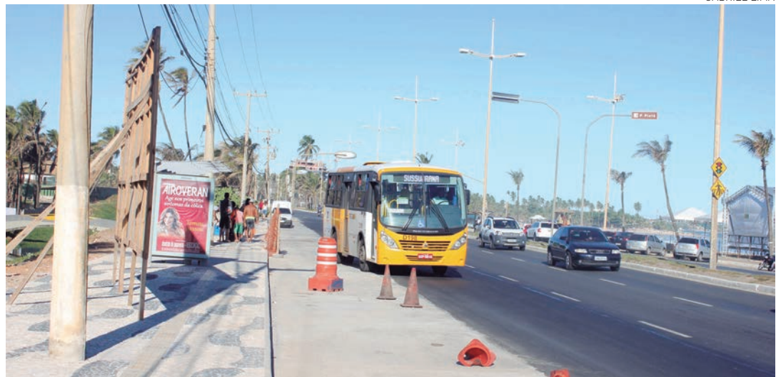
Em frente ao Sesc Piatã, sentido Pituba, terá uma baía com capacidade de parada simultânea para até oito ônibus