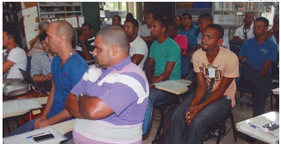
Os primeiros 40 multiplicadores passaram por treinamento de 20 horas, divididas em aulas teóricas e práticas