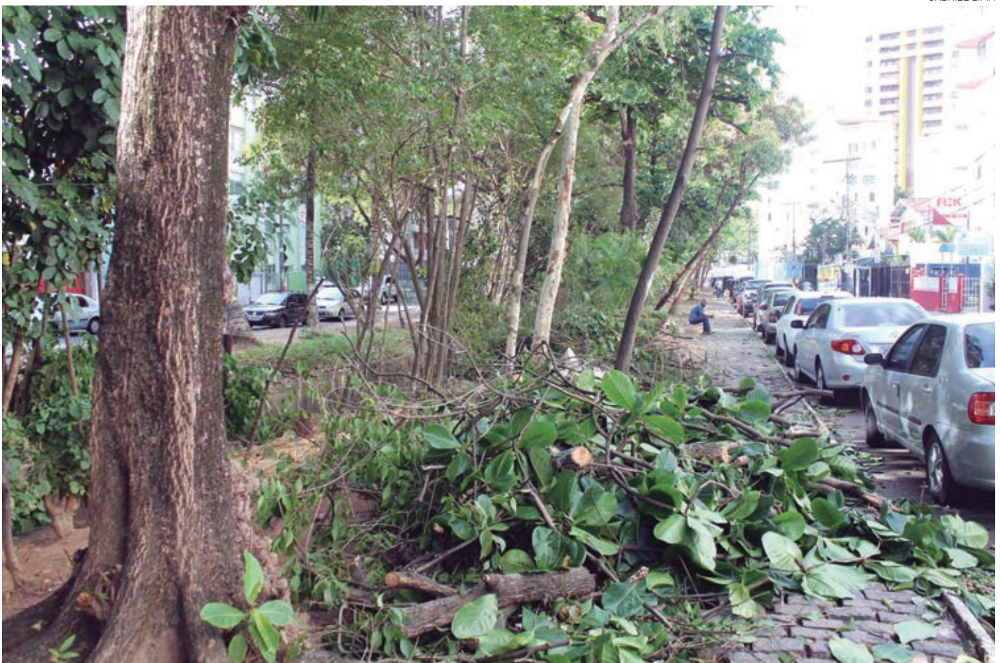
Os trabalhos estão sendo realizados em várias áreas da cidade e visam melhorar a estética das ruas, além de contribuir para a segurança da população