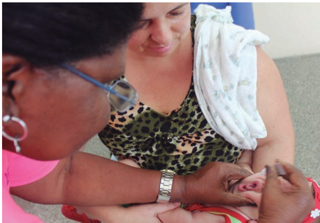
A meta é imunizar contra a paralisia infantil 95% do público alvo, mais de 156 mil crianças na capital