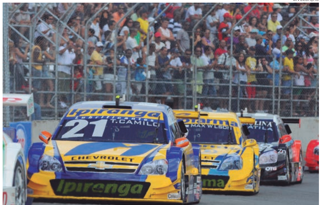
A corrida acontece no dia 15 deste mês, devendo atrair milhares de amantes da modalidade esportiva ao CAB