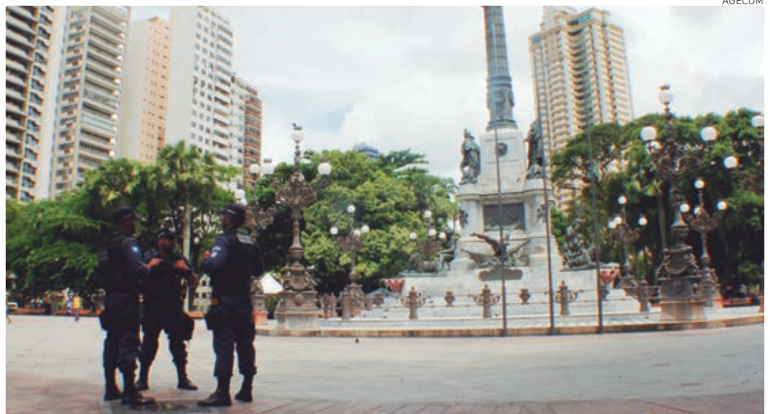
A iniciativa dá condições às pessoas de praticarem exercícios ao ar livre em um espaço como o Campo Grande

inidônea pela administração pública pode participar da licitação, desde que apresente a carta de intenção e uma proposta-resumo. O formulário, bem como o edital, está disponível no site www.verdeperto.salvador.ba.gov.br .