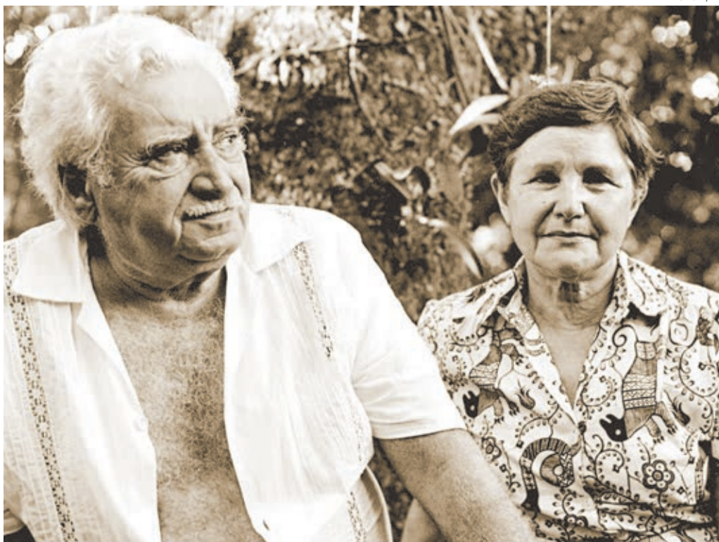
O memorial vai permitir que baianos e turistas mergulhem na intimidade de Jorge Amado e de Zélia Gattai