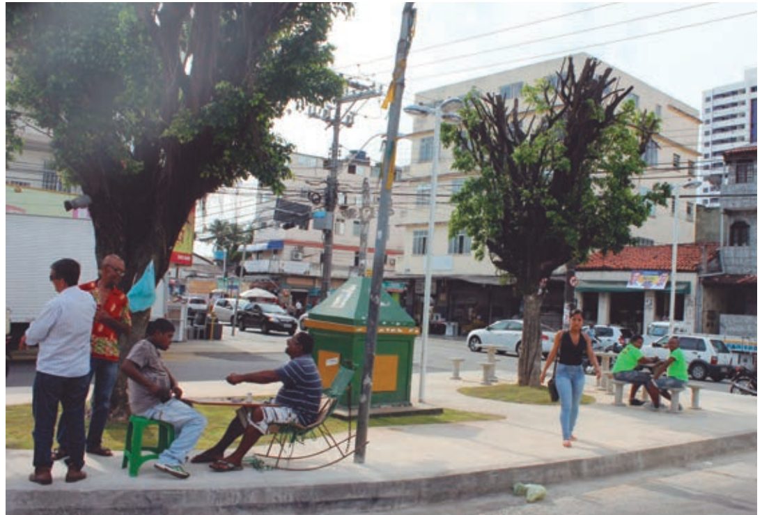
Apesar de pequeno, na Ladeira da Redenção o espaço é muito frequentado, principalmente por idosos