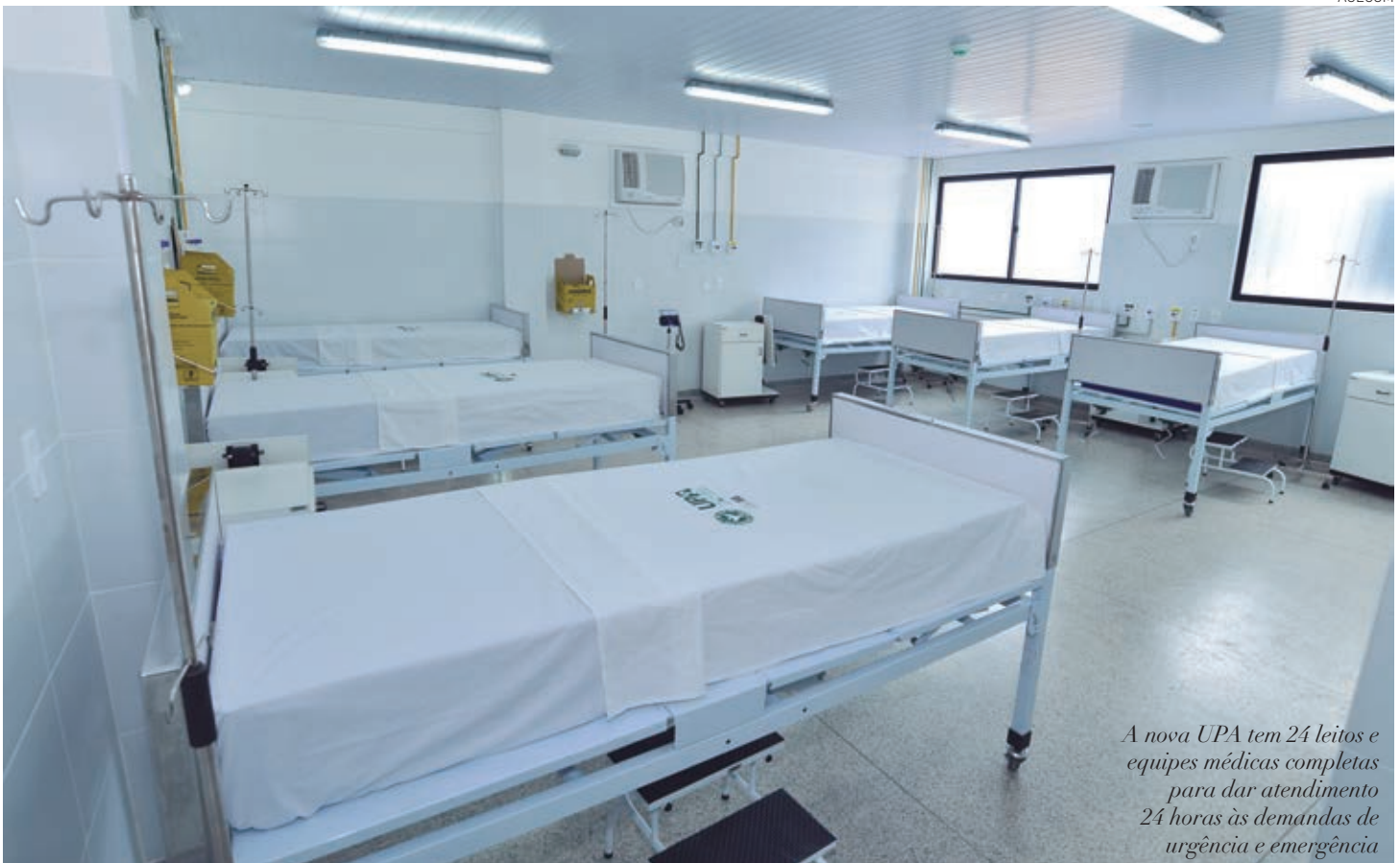
A nova UPA tem 24 leitos e equipes médicas completas para dar atendimento 24 horas às demandas de urgência e emergência