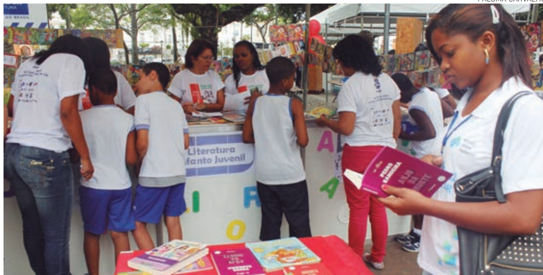
O visitante escolhia uma publicação e esta era doada para assegurar a democratização do acesso ao livro