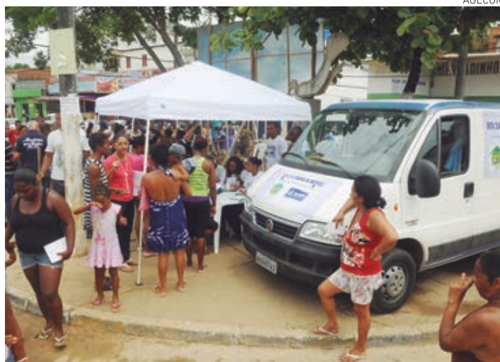
No Cras os interessados podem tirar dúvidas sobre os benefícios oferecidos

Os interessados podem tirar dúvidas sobre os benefícios oferecidos pela Prefeitura e realizar atualização ou inclusão no Cada-