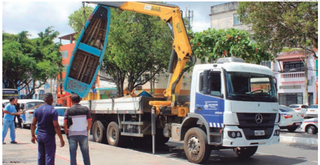
Carcaças e sucatas de barcos estão sendo retiradas da praia da Ribeira pela Prefeitura do Salvador