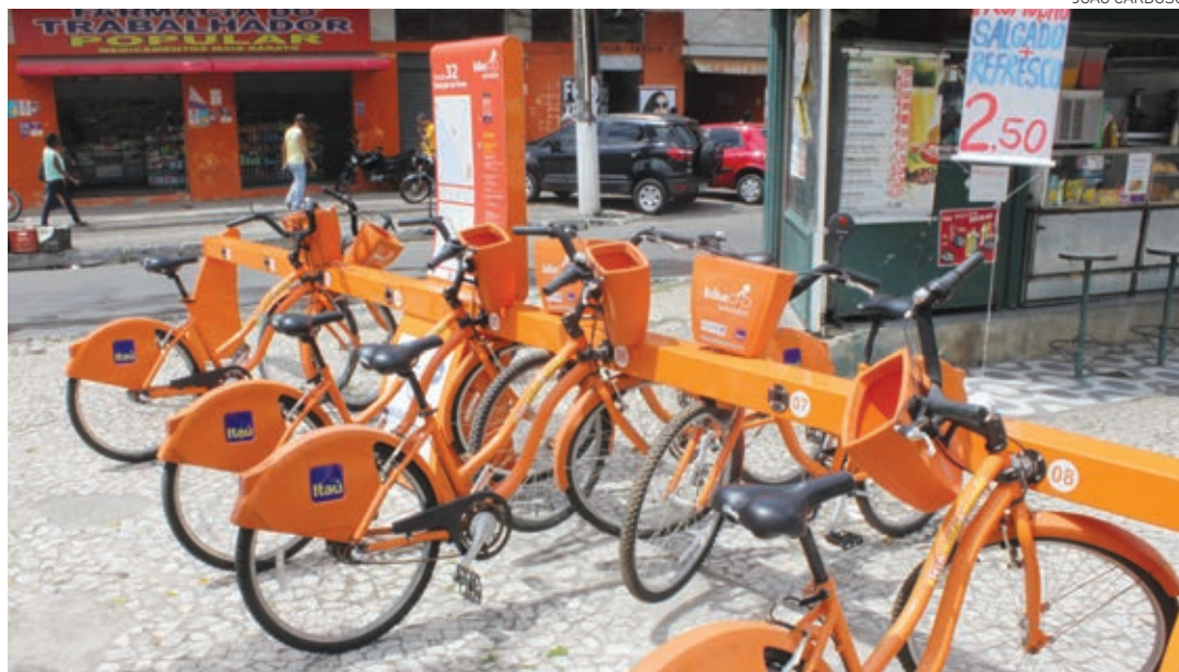
A integração do sistema de bicicletas compartilhadas ao transporte coletivo amplia as condições de mobilidade