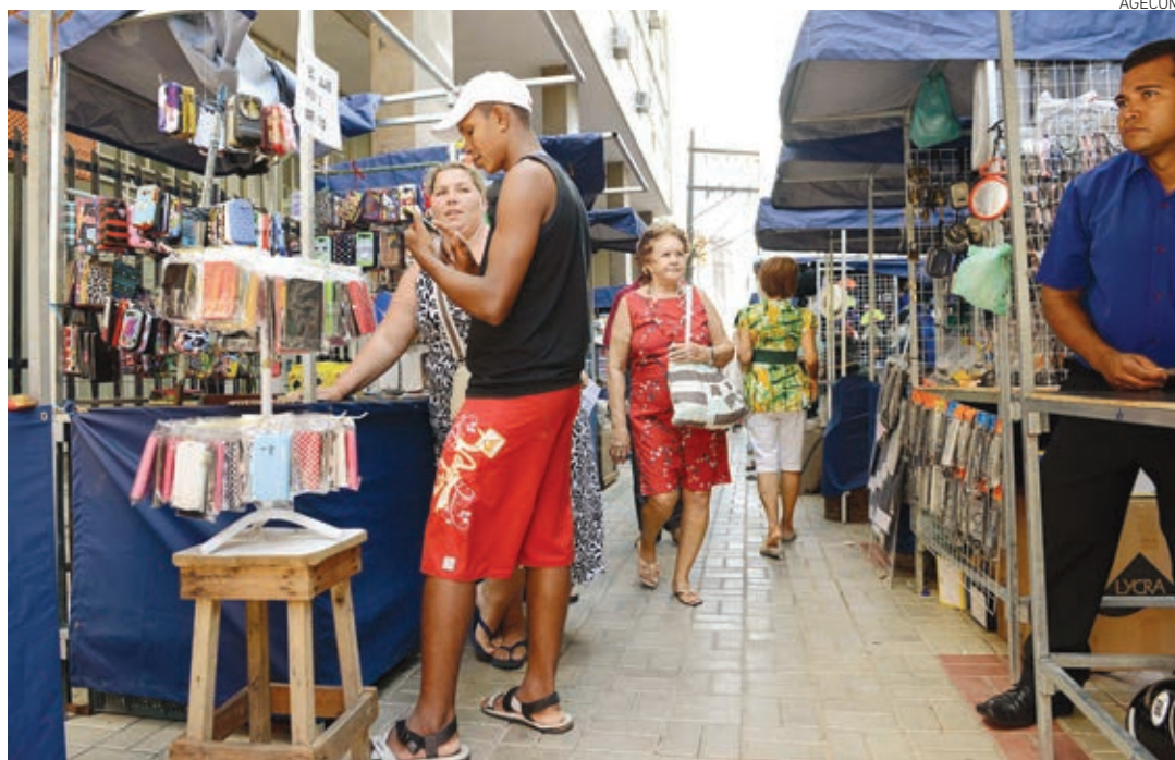
Comerciantes informais de Salvador têm prazo para adesão ao PPI da Semop até 31 de outubro de 2014

O PPI exclusivo para débitos junto à Secretaria Municipal da Ordem Pública (Semop) vai permitir que contribuintes em dívida com a pasta possam regularizar suas pendências em excelentes condições, com redução de até 100% dos juros, independentemente do prazo de pagamento, diminuição de honorários e desconto de 75% no valor das multas para quitação à vista, além de parcelamento em até 120 meses. O programa prevê parcelamento das dívidas com Taxas de Licença para Exploração de Atividades em Logradouros Públicos (TLP) e Preços Públicos da Semop, com fatos geradores ocorridos até 31 de dezembro de 2012. Os contribuintes receberão uma carta-proposta que será enviada pela Prefeitura com condições de pagamento à vista ou em até 24 meses. Caso ele não concorde com a proposta oferecida pela Prefeitura, poderá se dirigir à sede da Secretaria Municipal da Fazenda (Sefaz) para simular outras formas de parcelamento, podendo chegar a até 120 meses. As parcelas deverão ter valor mínimo de R$ 50 para pessoas físicas e R$ 500 para jurídicas. O prazo para