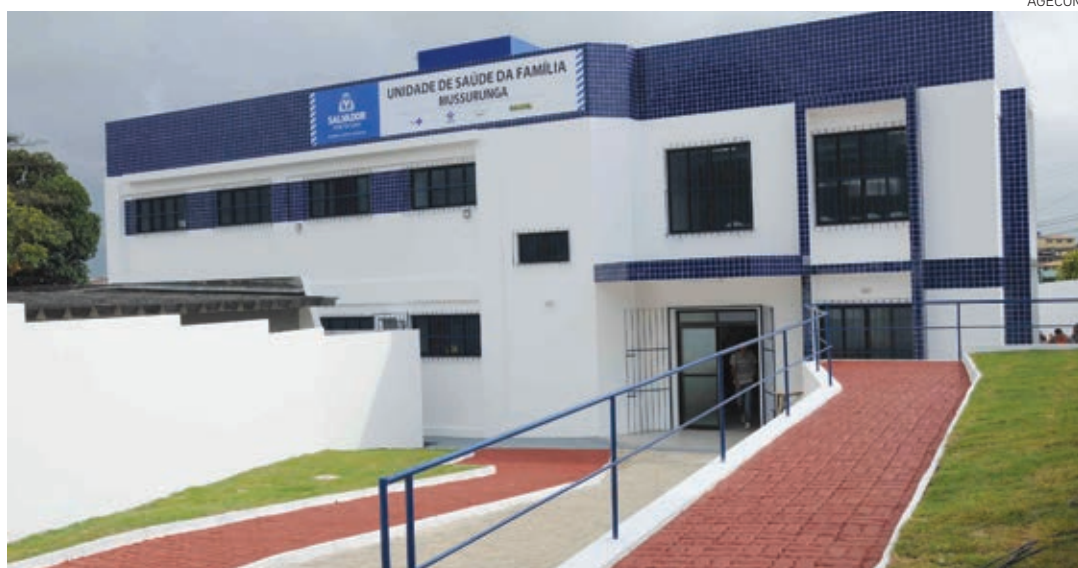
Posto de Mussurunga, entregue ontem à comunidade, tem capacidade de atender 16 mil pessoas por mês

Durante a solenidade, ACM Neto também anunciou importantes intervenções da Prefeitura no setor de urgência e emergência na região de Mussurunga. “Na próxima semana, vamos inaugurar a UPA Hélio Machado, em Itapuã, cujas obras tiveram expressivos recursos dos cofres municipais. Em São Cristóvão, também estamos construindo outra UPA que será de suma importância para absorver as demandas de emergência nesse distrito sanitário”, finalizou o prefeito.