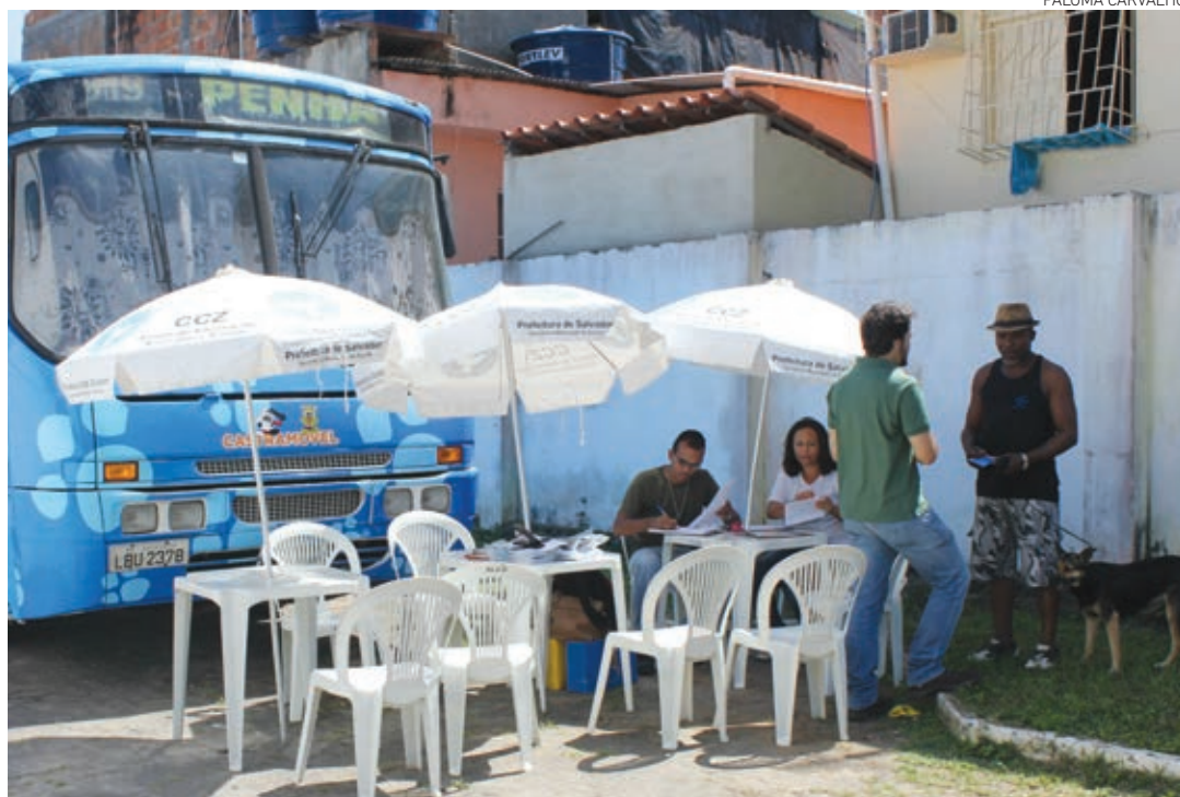
O atendimento, iniciado na última segunda-feira, é gratuito e está sendo feito na USF do bairro