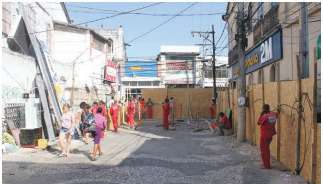
Os ambulantes voltarão a atuar de forma ordenada e padronizada, assim que terminarem as intervenções