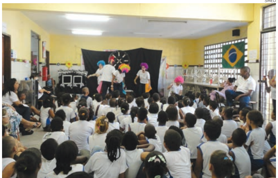
O Projeto Mário Gusmão Vai à Escola objetiva contribuir nas atividades diárias com a criança

Programação inclui música, dança teatro, literatura e artes visuais