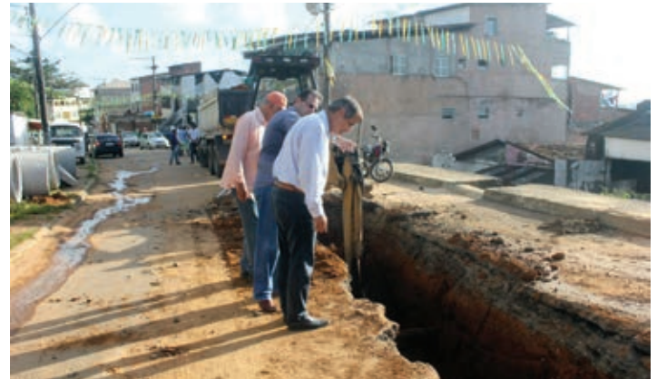
A obra tem custo total de R$ 6 milhões, com recursos da Prefeitura