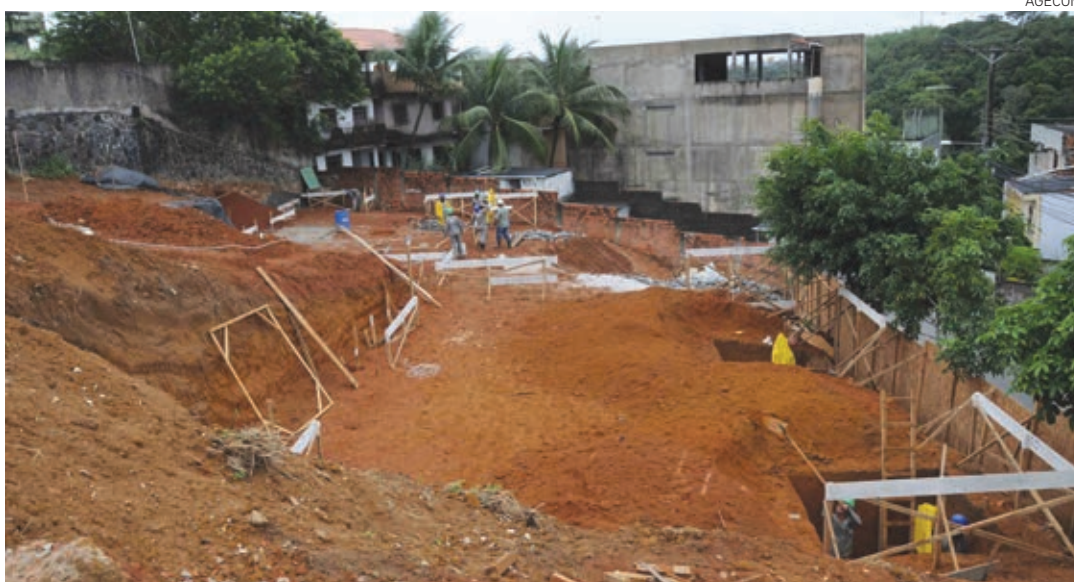
O terreno de 1960 m 2 , no Alto da Cachoeirinha, no Cabula VI, abrigará a unidade escolar, que terá três pavimentos