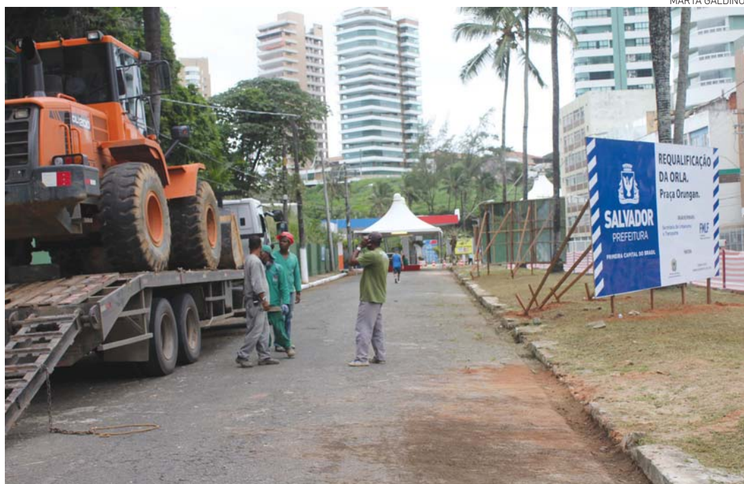
A construção da praça, denominada de Orungan em homenagem ao orixá do ar, deverá ser iniciada imediatamente