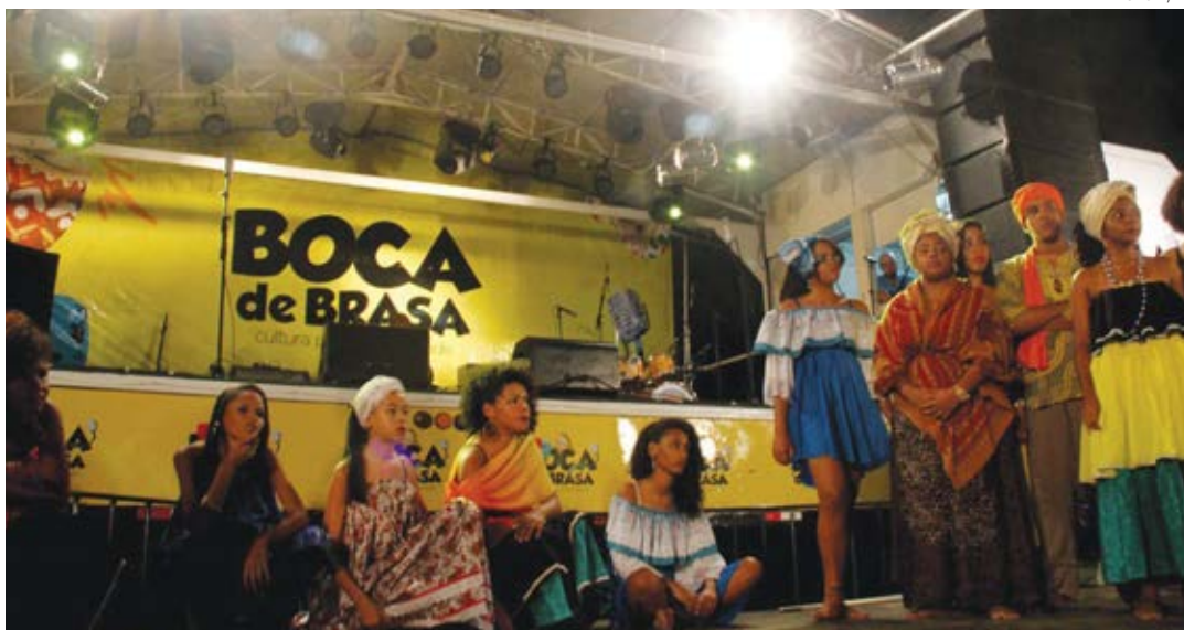
O Projeto Boca de Brasa objetiva incentivar e descobrir talentos nas comunidades, através das suas oficinas