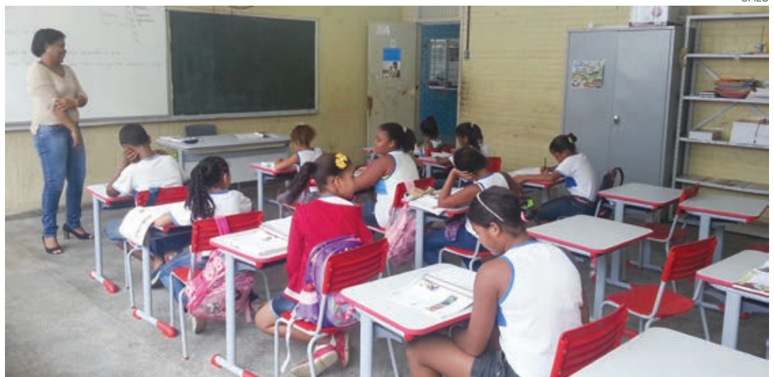
As aulas na rede municipal foram iniciadas no dia 27 de janeiro e o término está previsto para 23 de dezembro

Meu pai não acreditou quando soube que ia comigo porque a gente nem conhecia a Fonte Nova. Já tinha contado a todos os amigos da minha rua e queria muito que as aulas voltassem para contar a todos e para rever meus amigos e professores. Ir para Copa foi o melhor presente da minha vida”, comemorou.