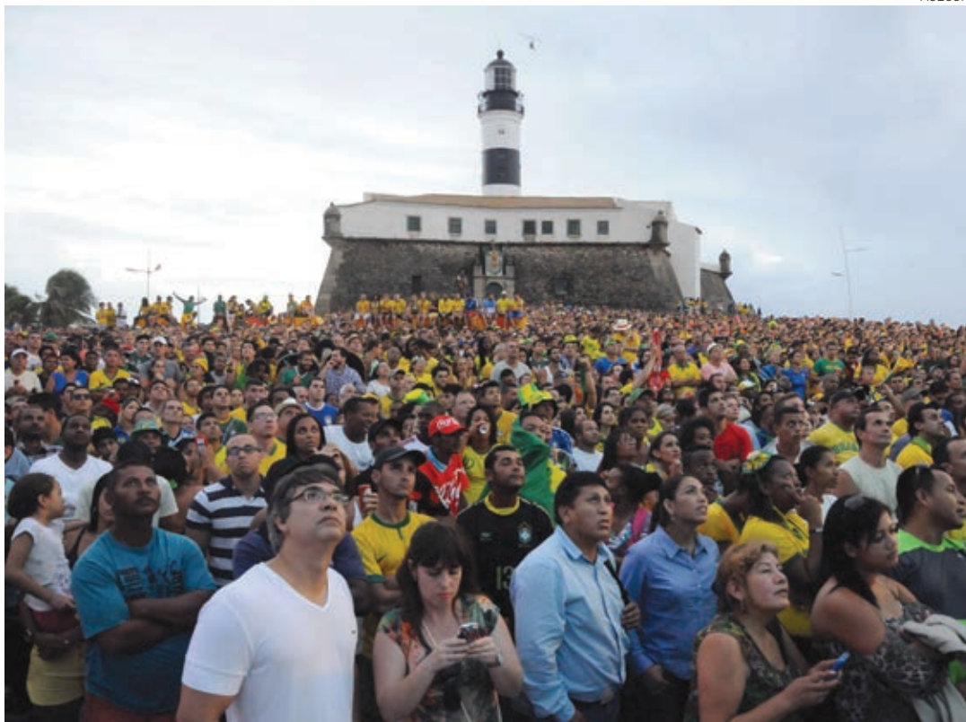
Milhares de torcedores foram ao Farol da Barra acompanhar pelo telão da Fan Fest o Brasil na abertura do Mundial