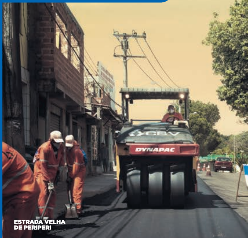
ESTRADA VELHA DE PERIPERI