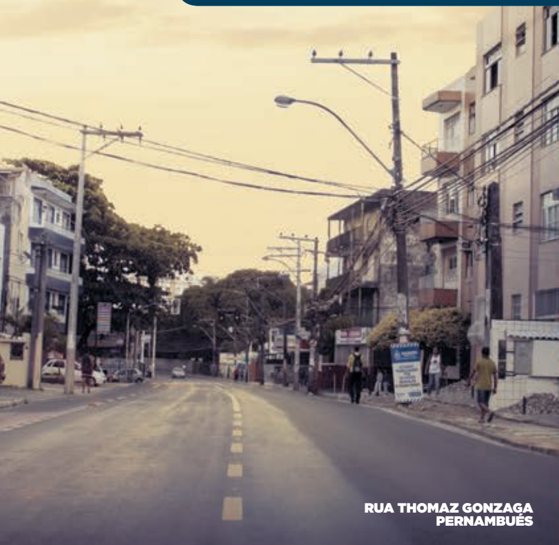
RUA THOMAZ GONZAGA PERNAMBUCÉS