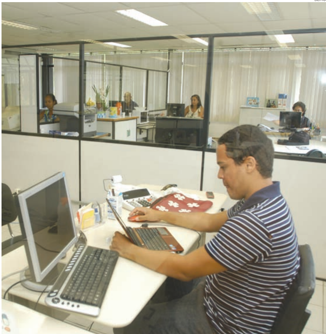
Após 12 anos de luta, os servidores municipais poderão ser beneficiados com o plano, que corrigirá defasagens salariais

em 20% do vencimento básico para agosto deste ano.