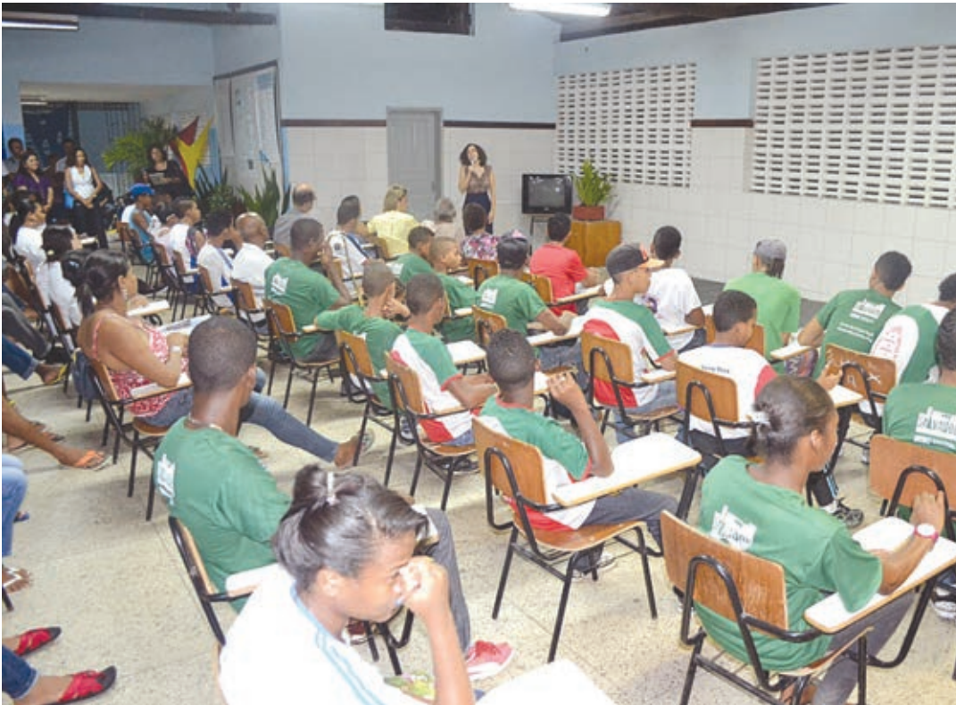
Iniciativa tem como proposta avaliar a política de Educação de Jovens e Adultos (EJA) da rede municipal de Salvador