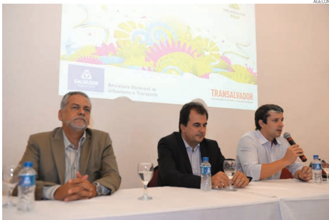
As ações especiais que serão realizadas na cidade foram anunciadas ontem pela Prefeitura, durante coletiva à imprensa

Já as interdições do tráfego serão feitas em dois perímetros: o primeiro a ser implantado a partir do próximo dia 21 até o dia 11 de julho, delimitando a área de uso exclusivo da FIFA. As barreiras de trânsito que irão formar o segundo perímetro serão instaladas cinco horas antes do início dos jogos na Arena Fonte Nova. Às 20h do dia que antecede cada partida, o acesso à Avenida Presidente Costa e Silva, em frente ao estádio, será interditado para viabilizar a montagem de estruturas de apoio ao evento esportivo.