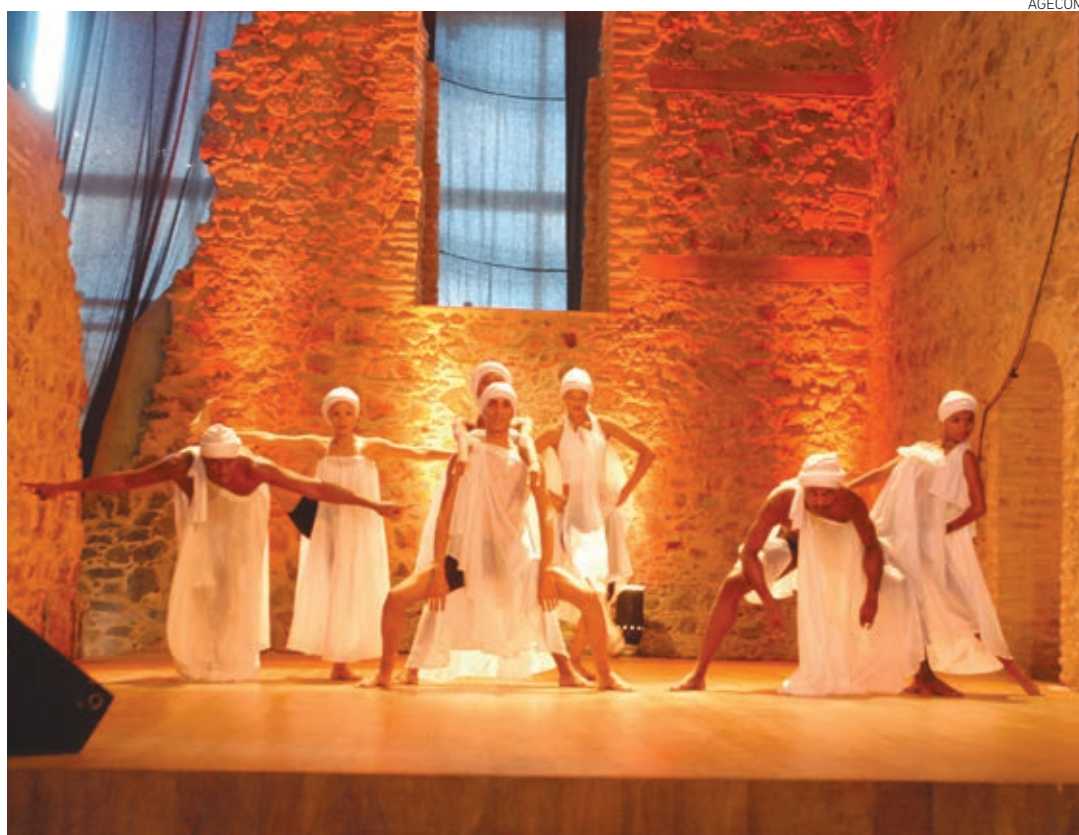
Transformada em espaço cultural, a antiga Igreja da Barroquinha volta a oferecer à população os mais variados espetáculos

O evento, que será aberto ao público, vai ser encerrado com a exibição de filmes com a atuação de Mário Gusmão (1928-2006), que dará o nome da sala onde serão realizados espetáculos. Gusmão foi ator, escritor, compositor, o primeiro dançarino da Escola de Teatro da UFBA e pioneiro a divulgar a produção artística da Bahia,