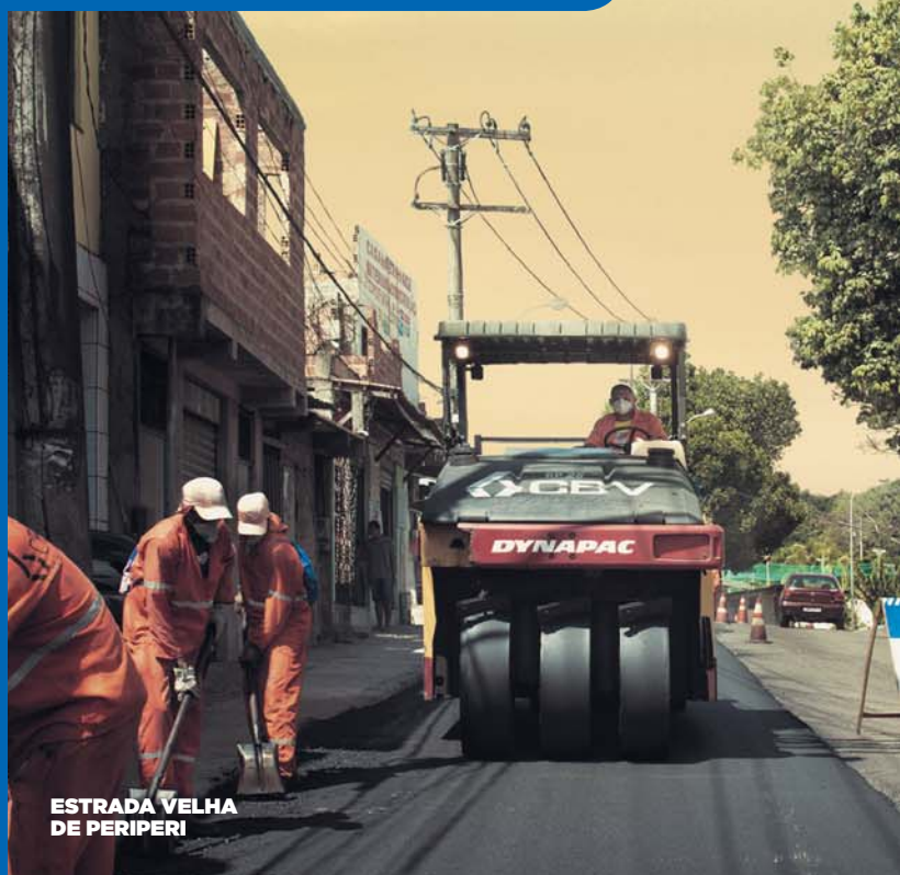
ESTRADA VELHA DE PERIPERI