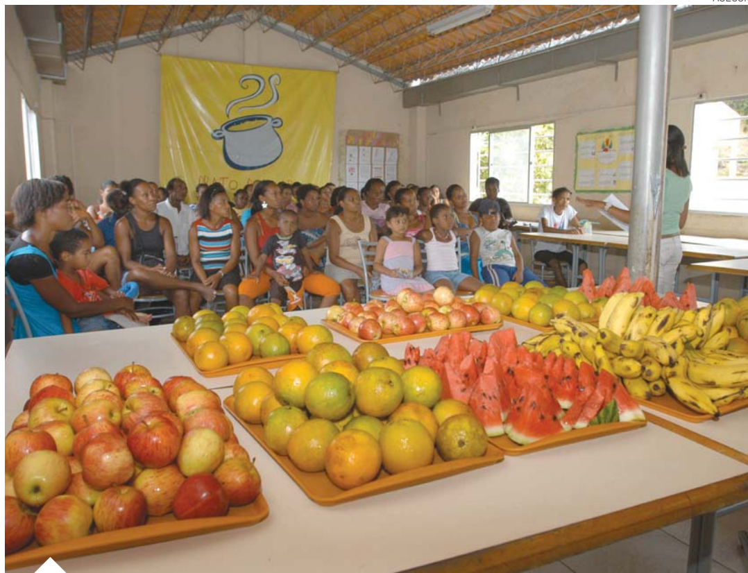
O restaurante funciona de segunda a sexta-feira, das 11h30 às 13h30, sendo a refeição gratuita para crianças com até 10 anos

O Restaurante Prato Popular, administrado pela Prefeitura em São Tomé de Paripe, através da Secretaria Municipal de Promoção Social e Combate à Pobreza (Semps), retomou ontem as atividades, após um mês fechado para reformas. Disponibilizado por meio de parceria com a Gerdau, Sodexo/Puras e Sesi, o serviço atende a 350 pessoas do bairro e comunidades vizinhas. O Restaurante Prato Popular funciona desde 2006 na Rua Santa Filomena, atendendo de segunda a sexta-feira, das 11h30 às 13h30. Para ter acesso às refeições, que custam R$ 0,50, os interessados devem fazer um cadastro, realizado às quintas-feiras pela manhã. É necessário ter renda familiar de até meio salário mínimo por pessoa e apresentar no local RG e certidão de nascimento das crianças. É importante lembrar que a refeição é gratuita para crianças até 10 anos