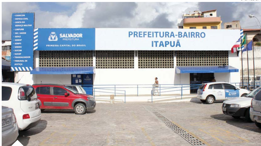
Unidade fica na Av. Dorival Caymmi, ao lado do Centro de Abastecimento do bairro, e funciona de segunda a sexta-feira

Cada Prefeitura-Bairro conta com um subprefeito e um conselho comunitário eleito nos bairros. Além da unidade do Centro/Brotas, o atendimento em Itapuã acontece de segunda a sexta-feira, das 8 às 17h. As próximas unidades das prefeituras descentralizadas a serem inauguradas estão em Cajazeiras (na rotatória de Cajazeira XIII), na Cidade Baixa (na Rua Porto dos Mestros, bairro da Ribeira) e no Subúrbio Ferroviário (na Rua Pará, em Paripe).