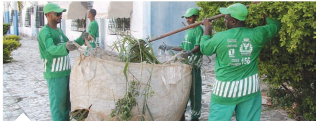
Atuação dos agentes de limpeza acontecerá normalmente em toda a cidade, na próxima quinta-feira, Dia do Trabalho