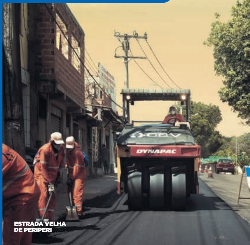
ESTRADA VELHA DE PERIPERI