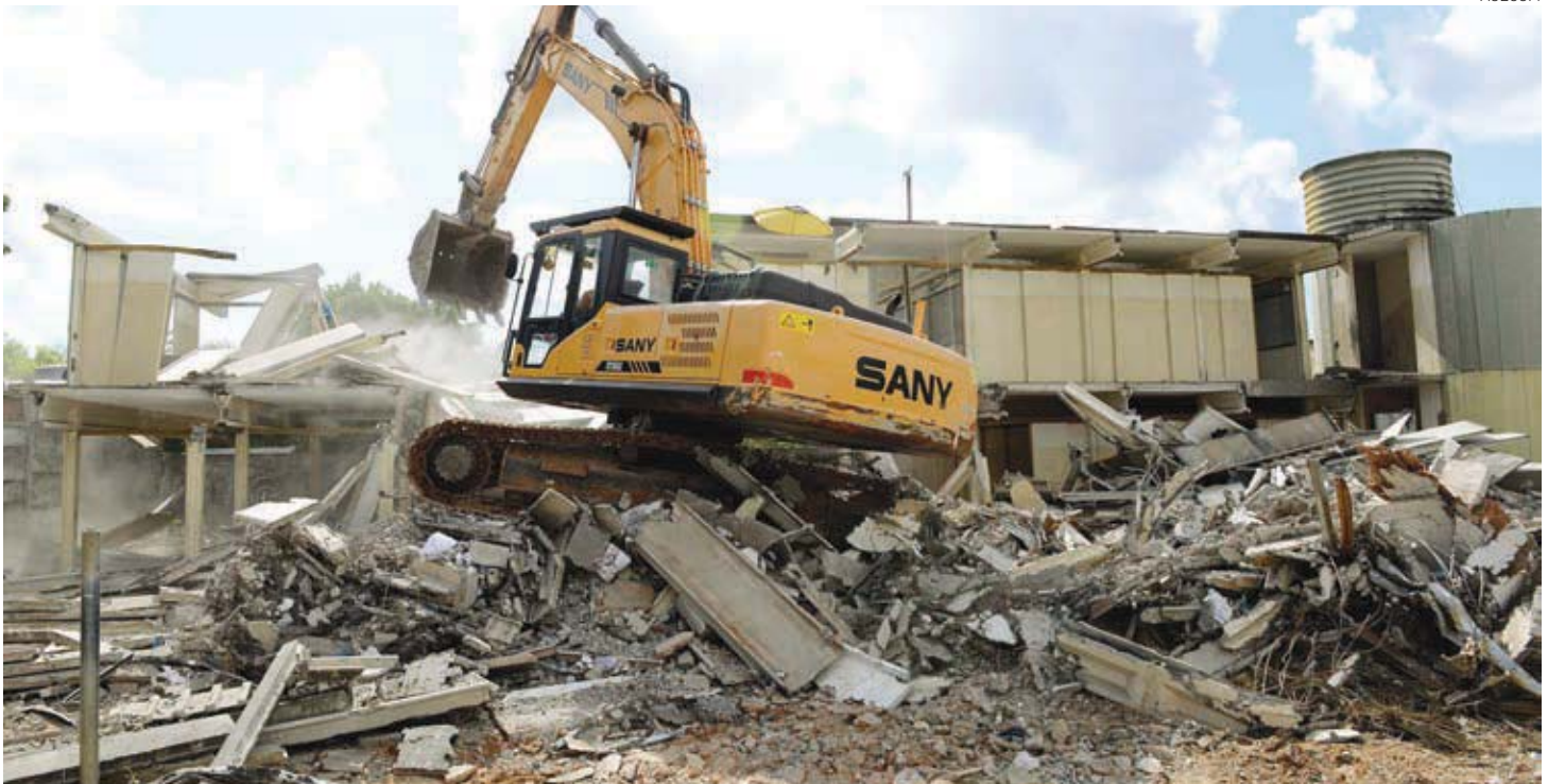
A Escola Municipal São Gonçalo, que funcionava com estrutura pré-moldada, está sendo demolida e será reconstruída, devendo ser inaugurada em 2015