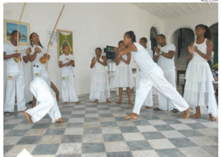
Ações de fortalecimento da capoeira estão entre as prioridades da atual gestão