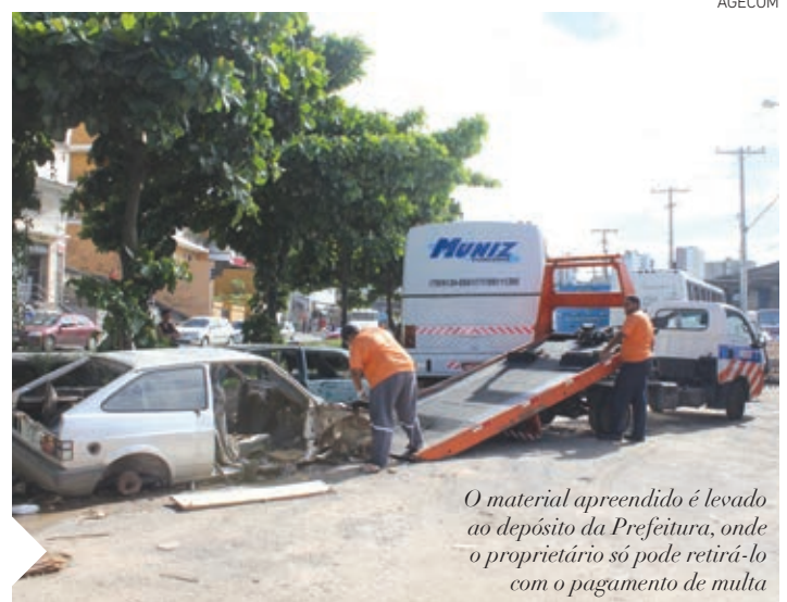
O material apreendido é levado ao depósito da Prefeitura, onde o proprietário só pode retirá-lo com o pagamento de multa

Setor de Serviços Diversos da Semop através dos números 156 ou 3186-5134.