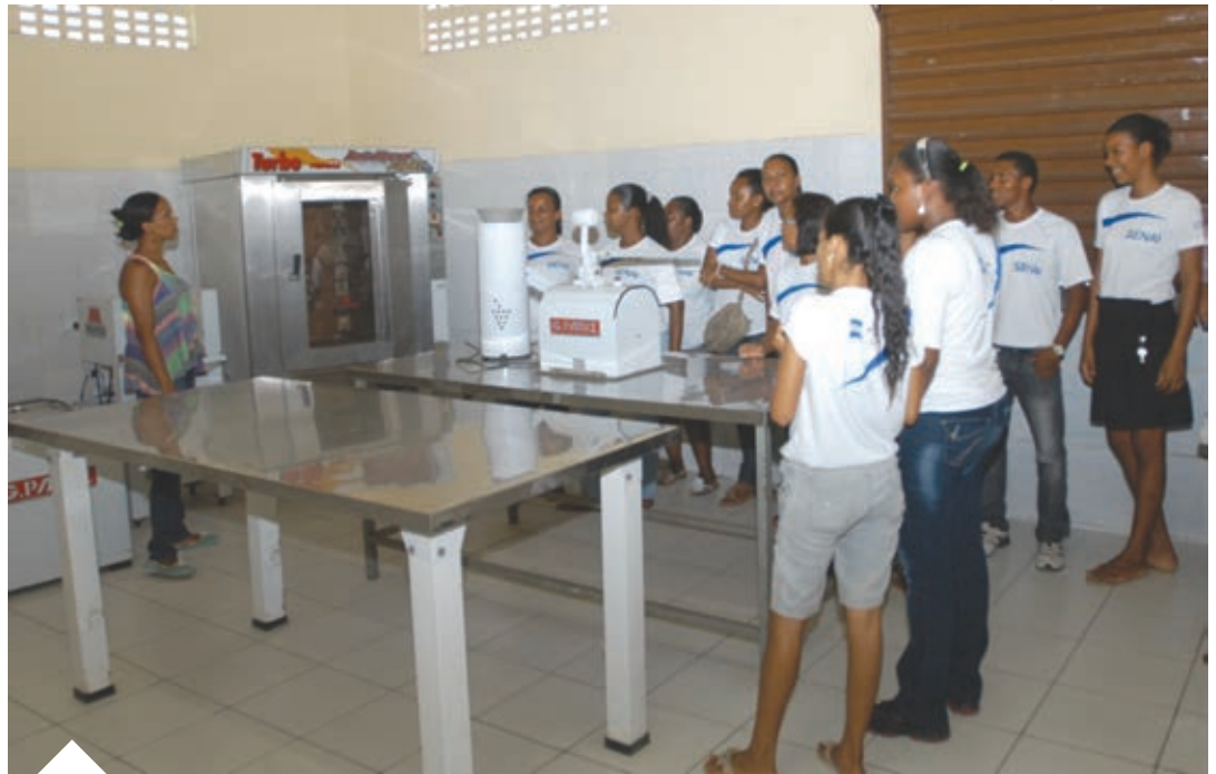
As parcerias ajudam a ampliar as ações da fundação, voltadas para o atendimento socioassistencial de adolescentes e jovens