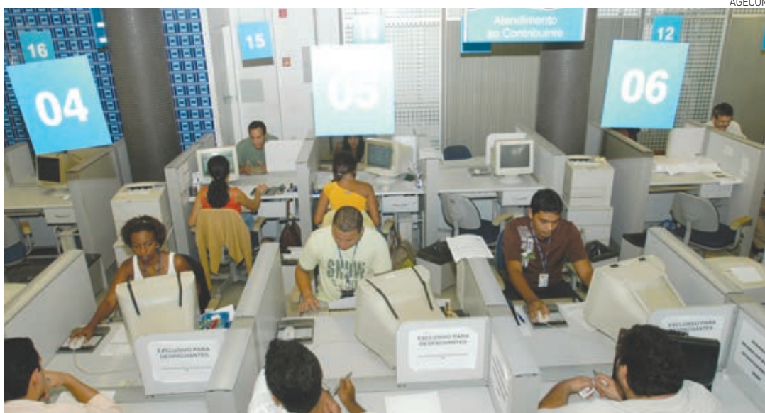
Os contribuintes poderão escolher o(s) débito(s) que desejam quitar e simular as diversas formas de pagamento

Os contribuintes poderão escolher o(s) débito(s) que desejam quitar e simular as diversas formas de pagamento. Após fazer a escolha, o contribuinte formalizará sua adesão ao programa ao efetuar o pagamento do DAM (Documento de Arrecadação Municipal) da 1ª parcela e/ou parcela única. Dívidas poderão ser esclarecidas pelo e-mail ppifaleconosco@sefaz.salvador.ba.gov.br .