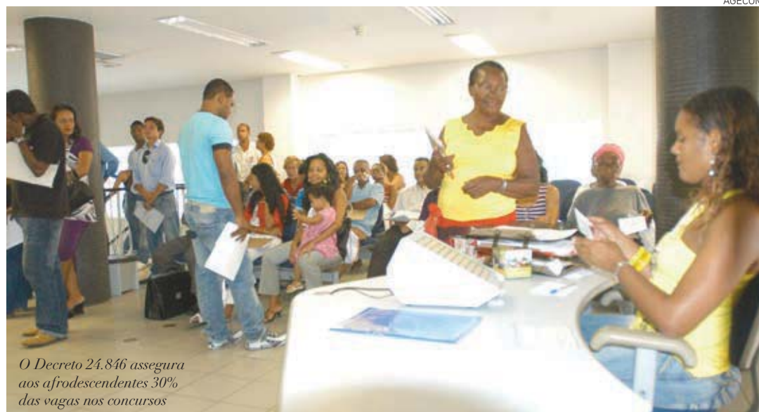
O Decreto 24.846 assegura aos afrodescendentes 30% das vagas nos concursos

De acordo com o Decreto 24.846, fica assegurado aos afrodescendentes 30% das vagas oferecidas nos concursos públicos para provimento de cargos efetivos e empregos públicos integrantes dos quadros permanentes de pessoal do Poder Executivo e das entidades da administração indireta de Salvador. A medida é válida para candidatos que se autodeclararem, no momento da inscrição, pretos ou pardos, conforme definição estabelecida pelo IBGE. A autodeclaração é facultativa e, caso seja detectada falsidade da declaração, o candidato será eliminado do concurso e, caso seja nomeado, ficará sujeito à anulação da admissão ao serviço público.