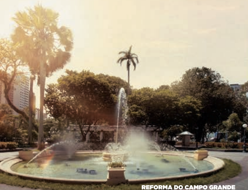
REFORMA DO CAMPO GRANDE