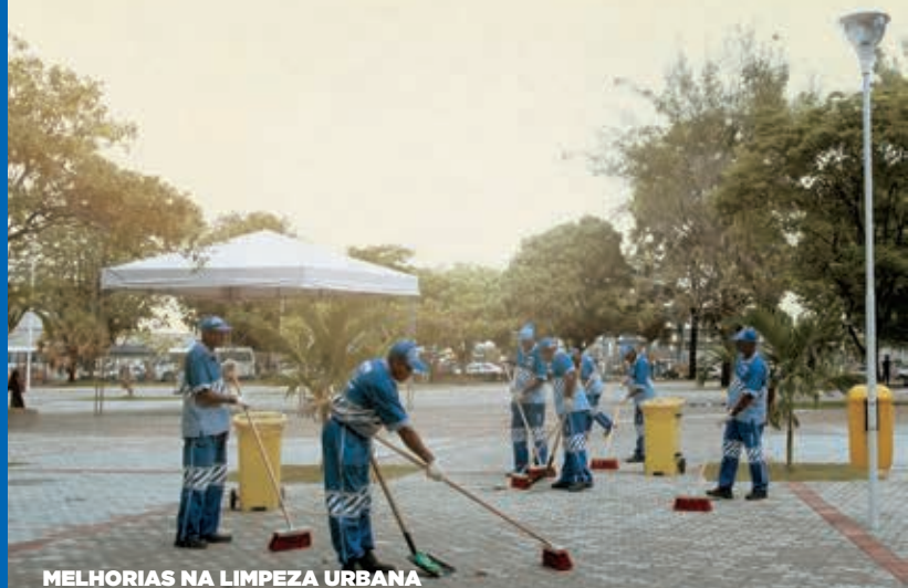
MELHORIAS NA LIMPEZA URBANA