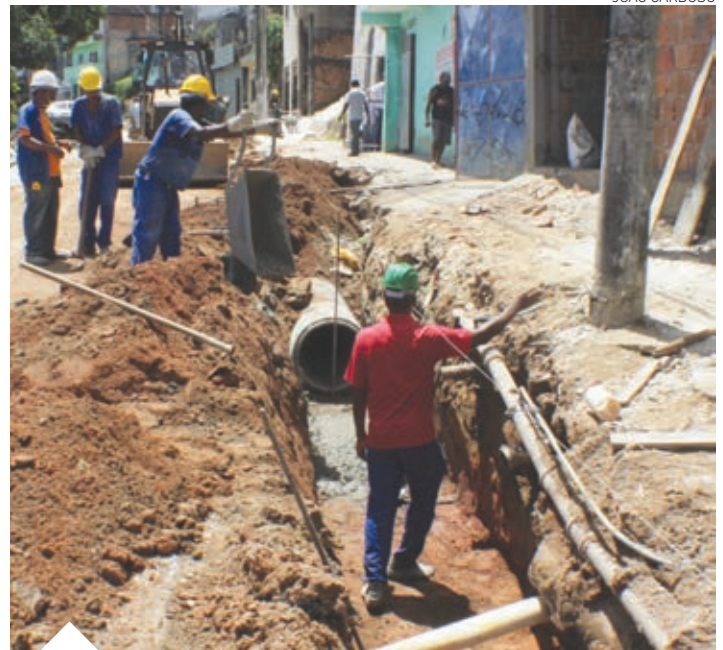
Já foram realizadas intervenções em 40 metros de drenagem no mês de fevereiro