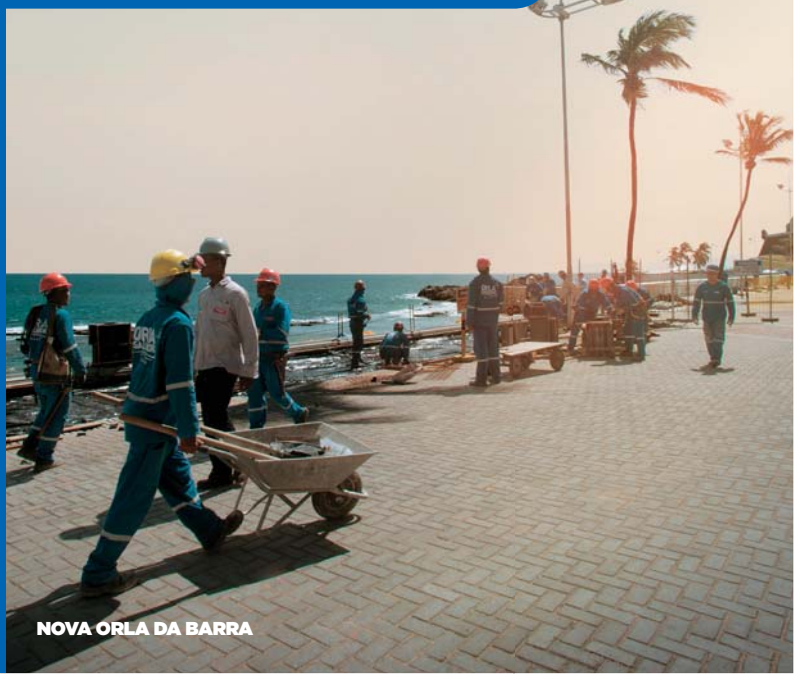
NOVA ORLA DA BARRA