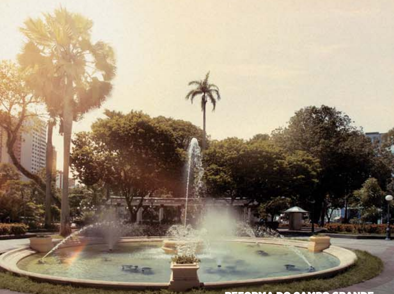
REFORMA DO CAMPO GRANDE

VÊM AÍ MAIS INVESTIMENTOS NA LIMPEZA DA CIDADE, NA EDUCAÇÃO, NA SAÚDE, NOVO ASFALTO E MUITAS OUTRAS OBRAS.