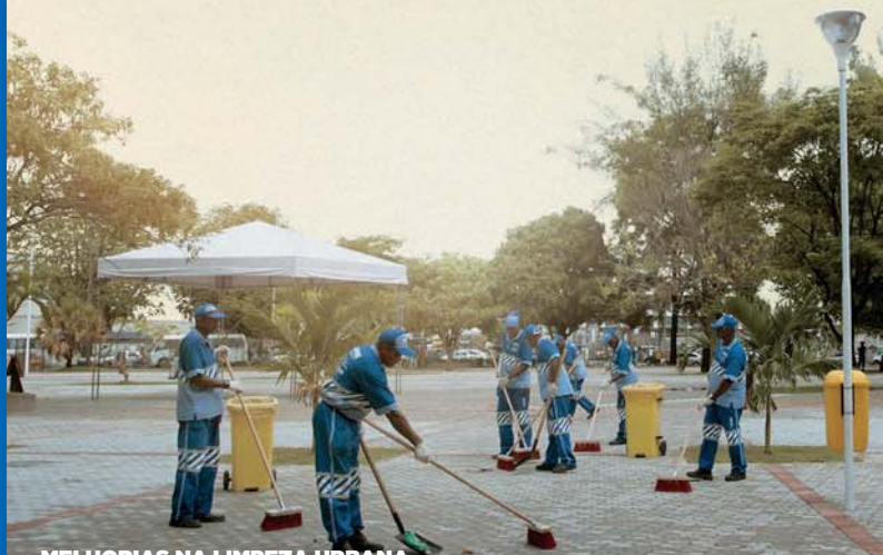
MELHORIAS NA LIMPEZA URBANA