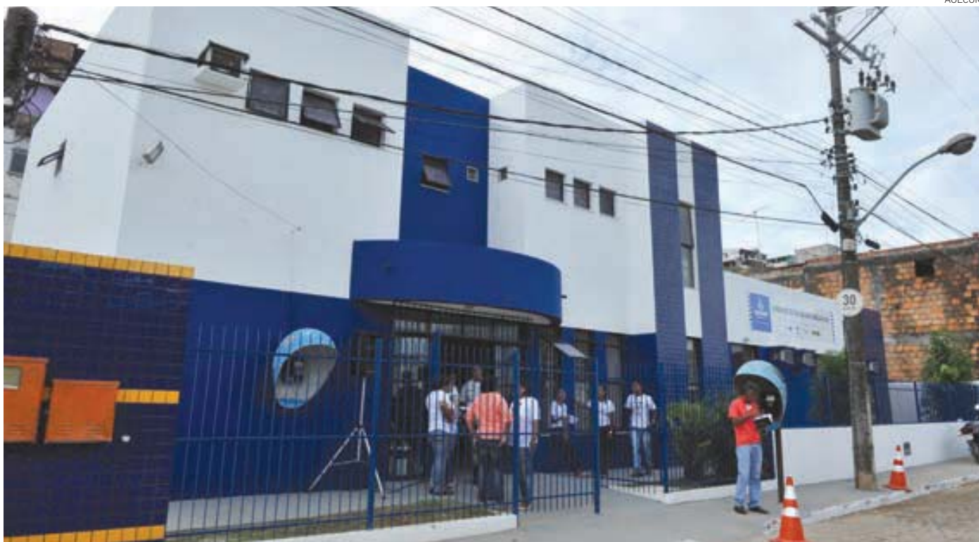
A Unidade de Saúde da Família Fiais, no Distrito Sanitário São Caetano/Valéria, foi reinaugurada ontem, totalmente reformada, equipada e mobiliada