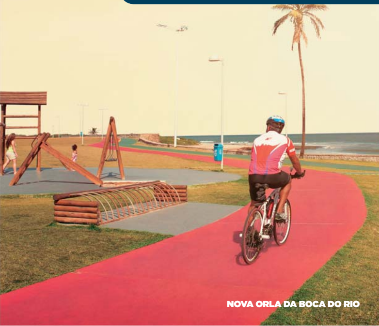
NOVA ORLA DA BOCA DO RIO