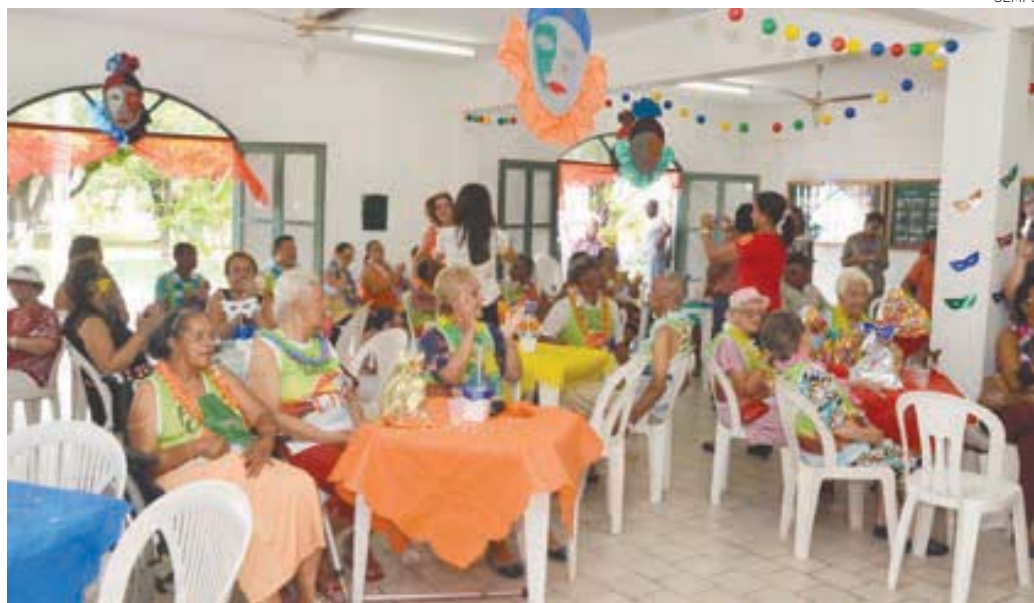
As atividades carnavalescas são compatíveis com os moradores do D. Pedro II e prosseguirão em paralelo à folia na cidade

Idosos residentes do Abrigo D. Pedro II, amigos e familiares participarão de uma festa de Carnaval enquanto for comemorada a folia na cidade. A Prefeitura, através da Secretaria de Promoção Social e Combate à Pobreza (Semps), promoverá atividades carnavalescas compatíveis com a faixa etária dos moradores do D. Pedro II.